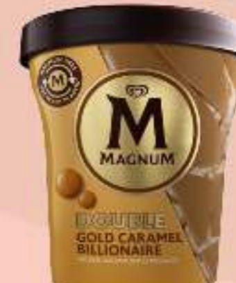
MAGNUM DOBLE GOLD CARAMEL BILLIONAIRE Ref.: 48045 8 ud./caja - 440ml - 303g