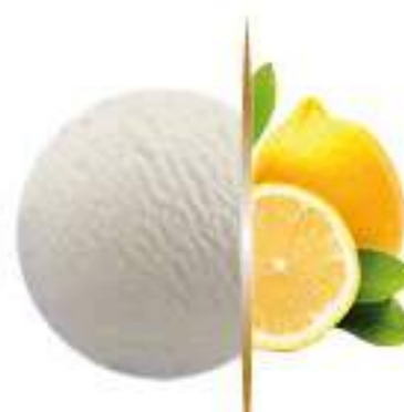
SORBETE LIMÓN Ref.: 63898 5L