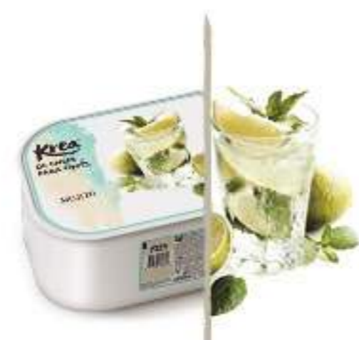
HELADO DE MOJITO 1 Ref.: 00153 - 2,5L