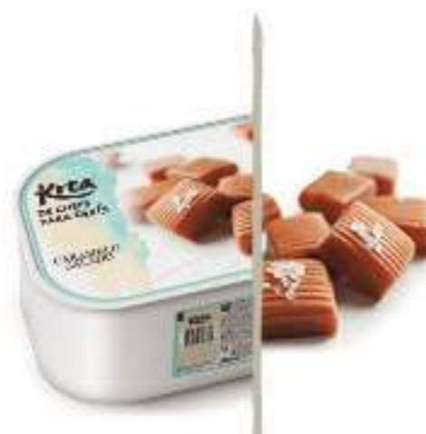
CARAMELO SALADO 1 Ref.: 00144 - 2,5L