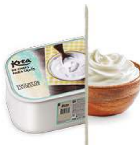
YOGURT 1 Con piñones tostados Ref.: 00156 - 2,5L