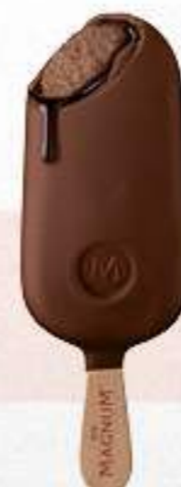
MAGNUM DOUBLE CHOCOLATE Ref.: 57798