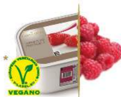
FRAMBUESA Ref.: 59641 2,4L