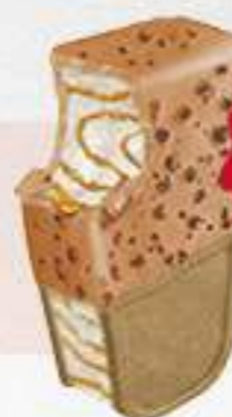
SÁNDWICH FILIPINOS CARAMEL Ref.: 67986