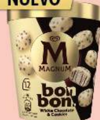
MAGNUM BONBON WHITE CHOCOLATE & COOKIES Ref.: 64046 8 ud./caja - 204ml - 168g