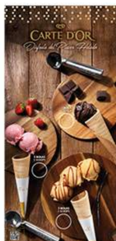
Cartel exterior Carte D'Or Ref.: 41591