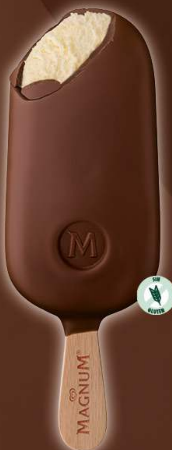
MAGNUM CLASSIC Ref.: 61238 20ud./caja - 110ml - 81 g