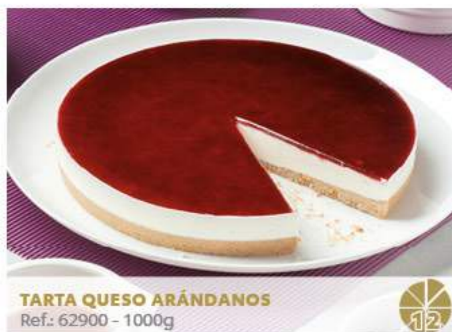
TARTA QUESO ARÁNDANOS