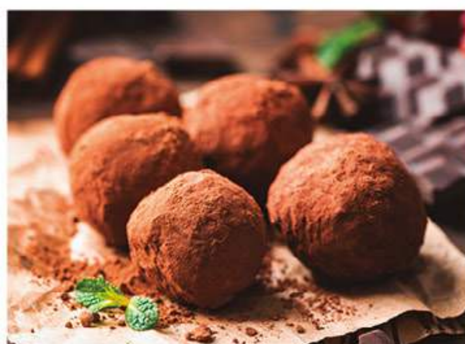
TRUFAS DE CHOCOLATE 1 Ref.: 62901 - 50 unidades de 15g