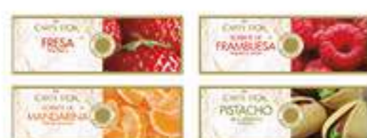
Etiquetas sabores Ref.: 41557