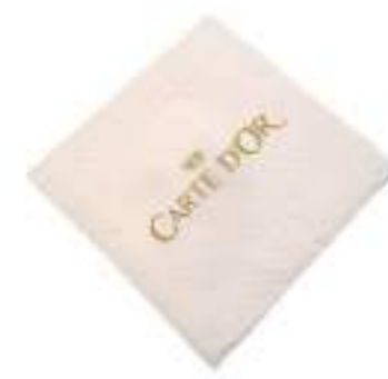
Servilletas Ref.: 3008