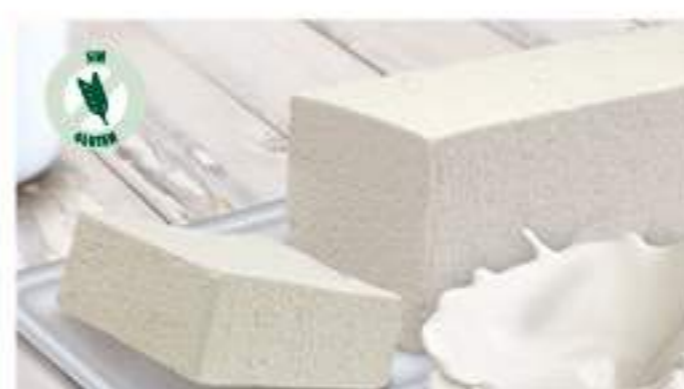
BLOQUE SABOR NATA 1 Ref.: 002521 1L