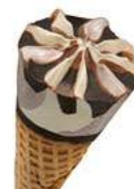
CONO VAINILLA-CHOCOLATE Ref.: 71464 110ml