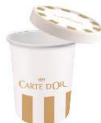
Tarrina 500ml Ref.: 3032 Tapa 500ml Ref.: 3036