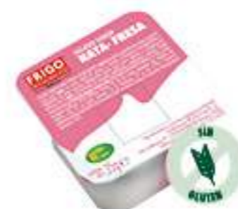
SABOR NATA-FRESA 1 Ref.: 000441 - 70ml