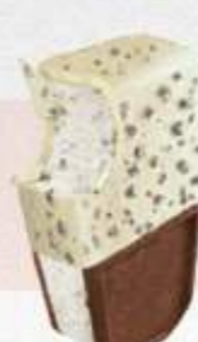
SÁNDWICH FILIPINOS BLANCO Ref.: 59745