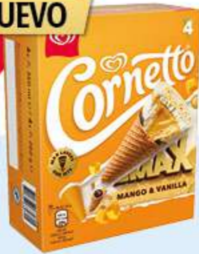
CORNETTO MAX MANGO Y VAINILLA Ref.: 68072 6ud./caja - 360ml - 260g