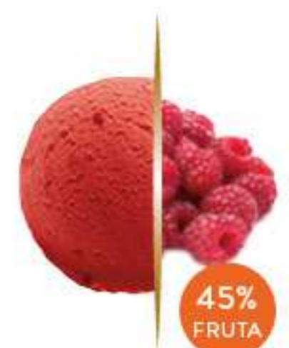
SORBETE FRAMBUESA Con trocitos de frambuesa Ref.: 83485 5500 ml - 3575 g