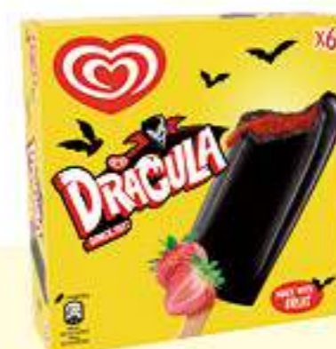
X6 DRÁCULA COLA Ref.: 91130 6 ud./caja 324 ml - 300 g