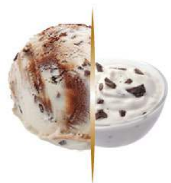
STRACCIATELLA Con deliciosos trocitos y salsa de chocolate Ref.: 80807 5500 ml - 2985 g