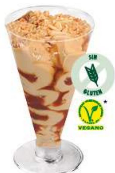
COPA TURRÓN SELECTO 1