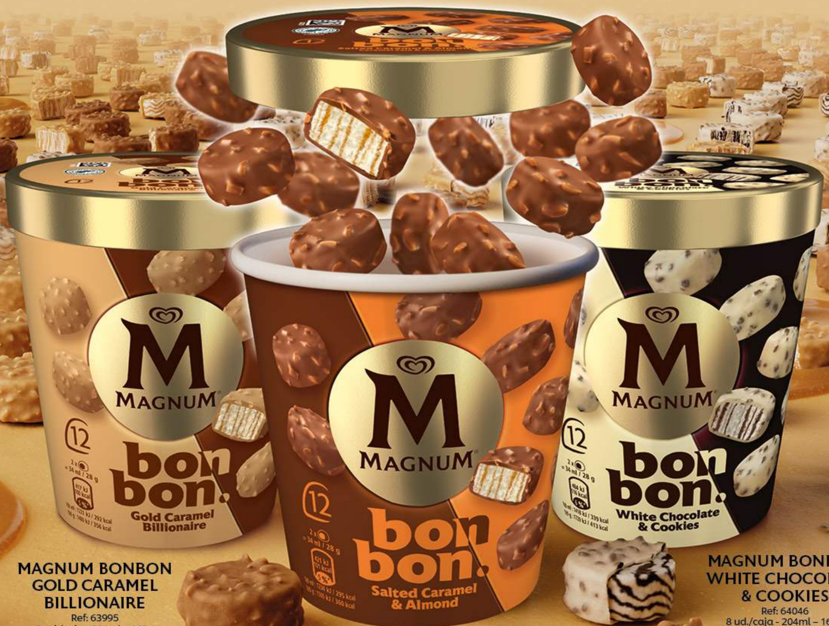
MAGNUM BONBON GOLD CARAMEL BILLIONAIRE Ref: 63995 8 ud./caja - 204ml - 168g