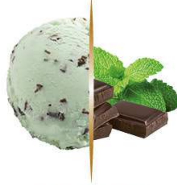
MENTA CHOC Crujientes láminas al chocolate Ref.: 83358 5500 ml - 2805 g