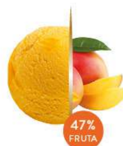
SORBETE MANGO Con trocitos de mango Ref.: 56421 5500 ml - 3575 g