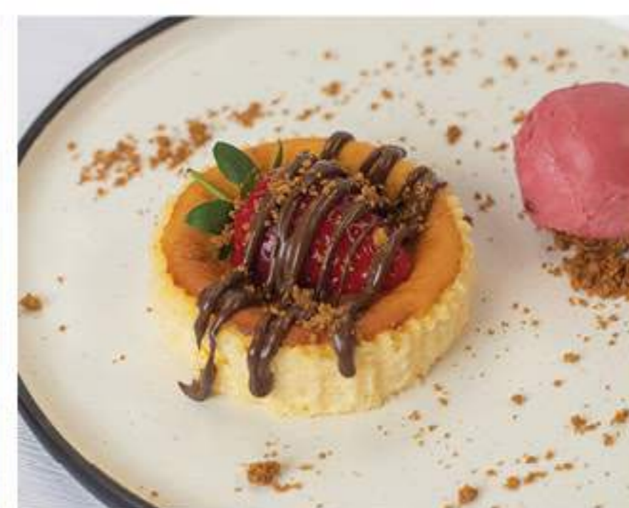
MINI TARTA DE QUESO ESTILO VASCO 1 Ref.: 62923 - 12 unidades de 100g