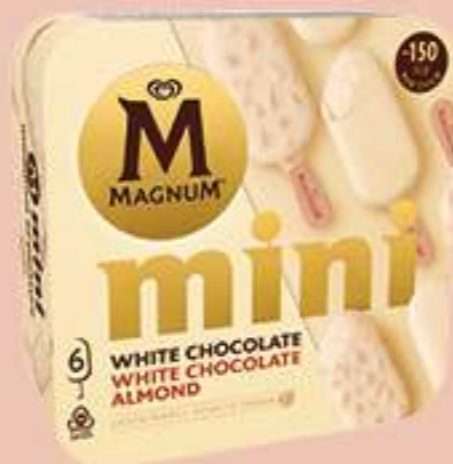
X6 MAGNUM MINI CHOCOLATE BLANCO Ref.: 60972 6 ud./caja - 330 ml - 267g