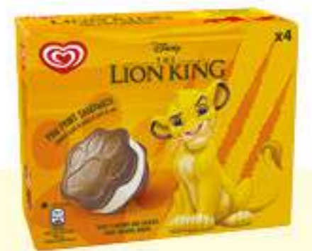
LION KING Ref.: 63336 8 ud./caja 240ml - 152g