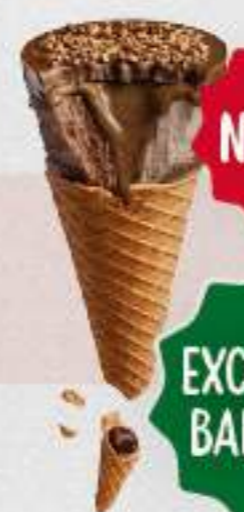
CORNETTO MAX AVELLANAS Y CHOCOLATE NOCCIOLA Ref.: 68113