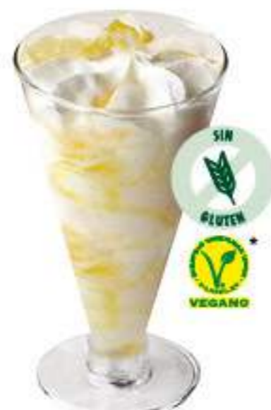
COPA LIMÓN 1