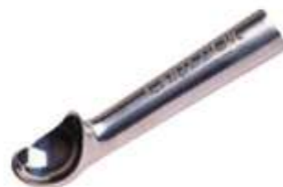
Cuchara térmica T16 Ref.: 3017 T20 Ref.: 3018 T24 Ref.: 3011