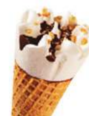
CONO NATA 1 Ref.: 00521 110ml