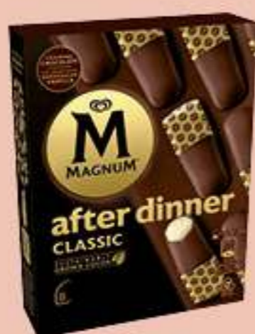
X8 MAGNUM AFTER DINNER CLASSIC Ref.: 62492 8 ud./caja - 280ml - 232g