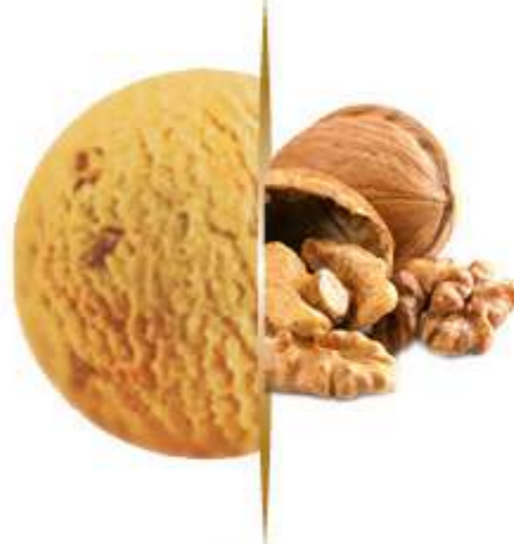
NUEZ Con nueces caramelizadas Ref.: 81590 5500 ml - 2750 g