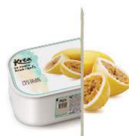
FRUTA DE LA PASIÓN 1 Ref.: 00142 - 2,5L