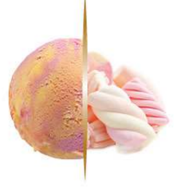
CHICLE Con espumas dulces Ref.: 98109 5500 ml - 2650 g