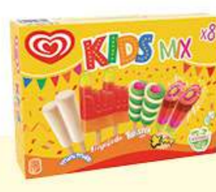
X8 KIDS MIX Ref.: 59249 6 ud./caja 428 ml - 360 g