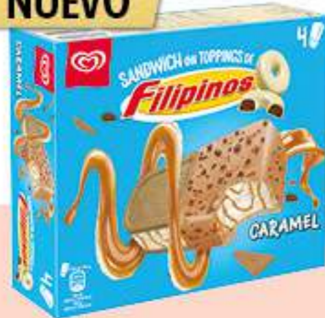
FILIPINOS SÁNDWICH CAMEL Ref.: 67968 6 ud./caja - 520ml - 308g