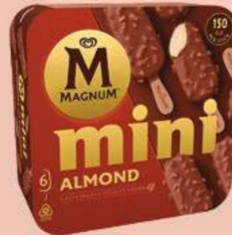
X6 MAGNUM MINI ALMENDRAS Ref.: 61196 6 ud./caja - 330 ml - 276g