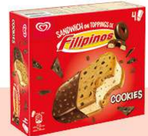
FILIPINOS SÁNDWICH COOKIES Ref.: 64204 6 ud./caja - 520ml - 308 g