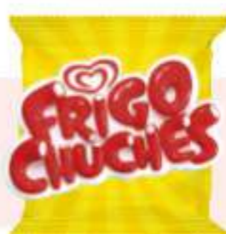
FRIGO CHUCHES - Ref.: 63498