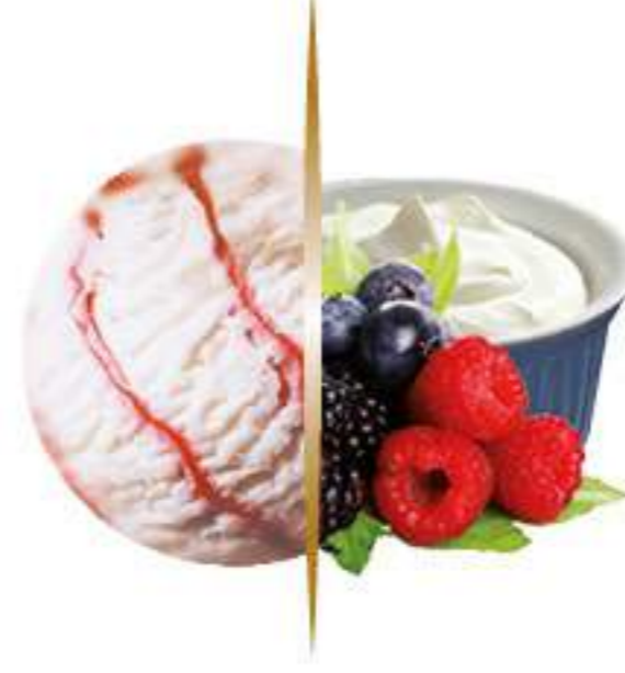
YOGUR & FRUTAS DEL BOSQUE Con salsa de frutas del bosque Ref.: 81586 5500 ml - 3050 g