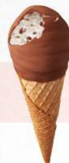
CORNETTO CHOCK'N'BALL Ref.: 54237