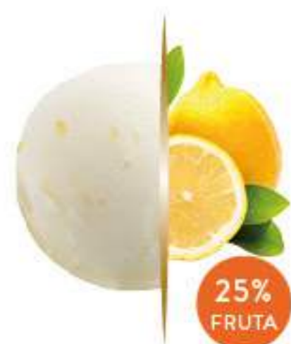
SORBETE CON LIMONES DE SICILIA Sin trocitos Ref.: 83468 5500 ml - 3100 g