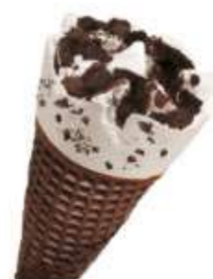
CONO COOKIES 1 Ref.: 00516 110ml