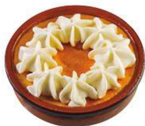
TARRINA AL WHISKY