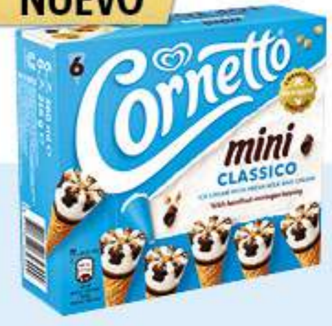
X6 CORNETTO MINI CLASSICO Ref.: 65645 5ud./caja - 360ml - 227g