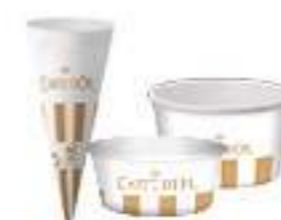
Consumibles Ref.: 3005 cono papel Ref.: 3098 vasito 80ml Ref.: 3081 vasito 200ml