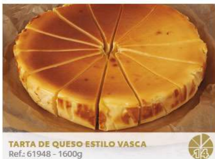
TARTA DE QUESO ESTILO VASCA