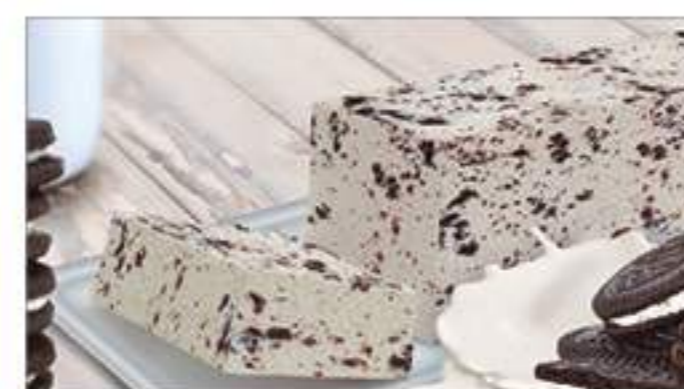
BLOQUE NATA CON GALLETAS AL CACAO 1 Ref.: 000258 1L