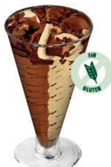
COPA DUO VAINILLA Y CHOCOLATE 1