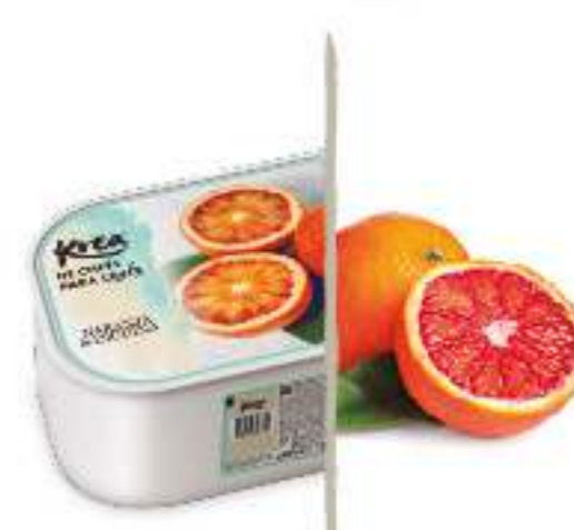
NARANJA SANGUINA 1 Ref.: 00157 - 2,5L