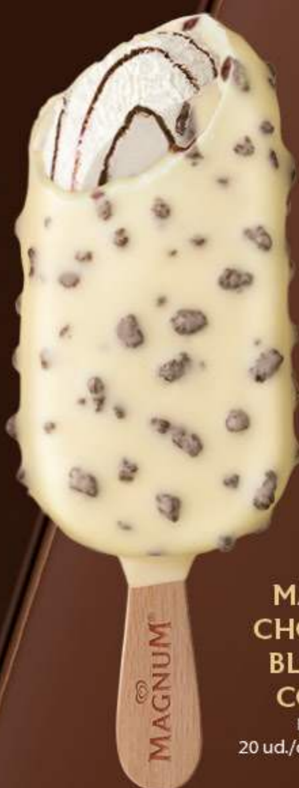
MAGNUM CHOCOLATE BLANCO & COOKIES Ref.: 69162 20 ud./caja - 90 ml - 74 g