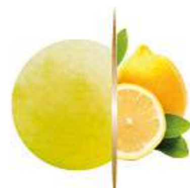
LIMÓN Ref.: 38660 5L