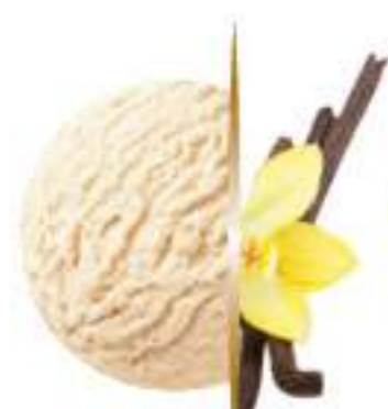
VAINILLA Ref.: 39580 5L

Gran relación calidad precio con un resultado de la bola en forma y textura ideal.