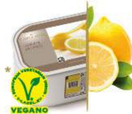
LIMÓN Ref.: 39807 2,4L