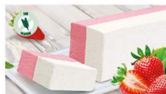
BLOQUE SABOR NATA FRESA 1 Ref.: 002531 1L