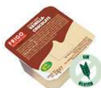
SABOR VAINILLA-CHOCOLATE 1 Ref.: 000440 - 70ml