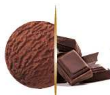
CHOCOLATE Ref.: 02075 5L