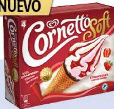
CORNETTO SOFT FRESA Ref.: 65539 6ud./caja - 560ml - 316g