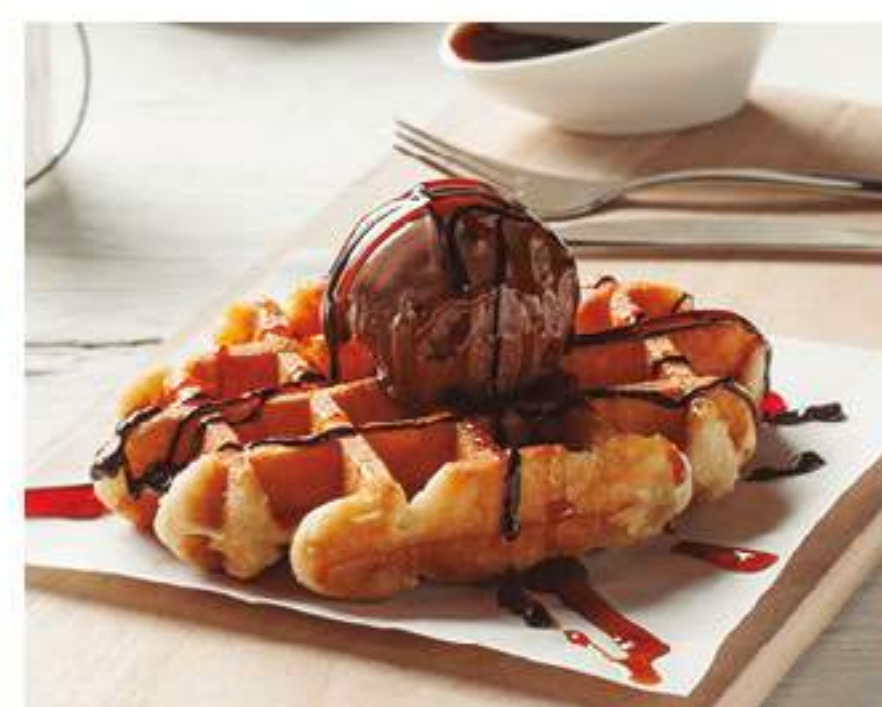
COFRE 1 Ref.: 58852 - 30 unidades de 90g