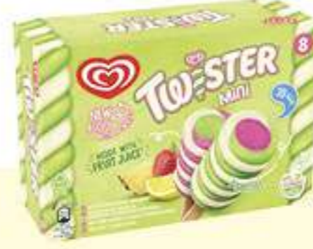
X8 TWISTER MINI PIÑA, FRESA Y SABOR LIMA-LIMÓN Ref.: 57682 6 ud./caja 400ml - 356g