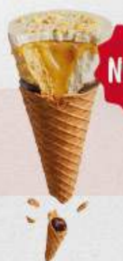
CORNETTO MAX MANGO Y VAINILLA Ref.: 68130