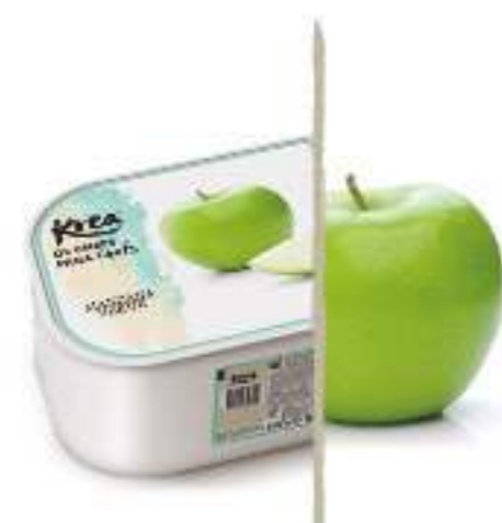
SORBETE DE MANZANA GRANNY SMITH 1 Ref.: 00152 - 2,5L