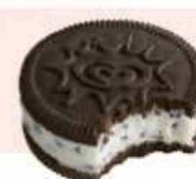
CORNETTO GO! Ref.: 64101