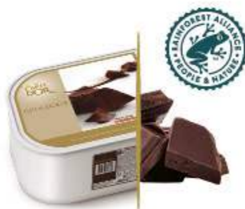
CHOCOLATE NEGRO CON CACAO DE ECUADOR Ref.: 46692 2,4L