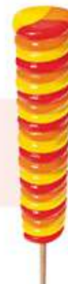
SUPER TWISTER - Ref.: 40281