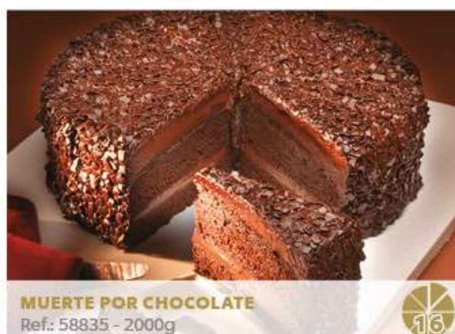
MUERTE POR CHOCOLATE