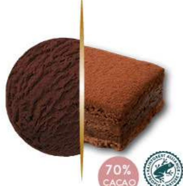
BROWNIE Helado de chocolate con salsa de chocolate y trocitos de brownie Ref.: 86174 5500 ml - 3000 g