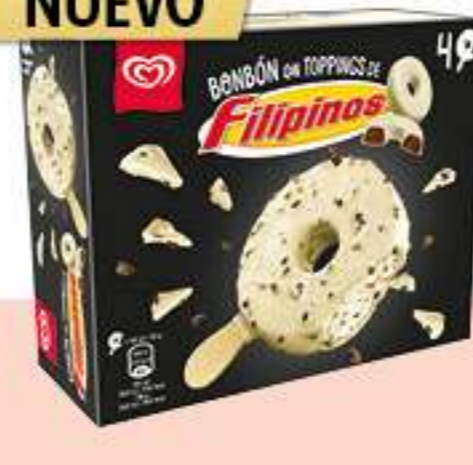
FILIPINOS BOMBÓN Ref.: 67820 6 ud./caja - 248ml - 148 g