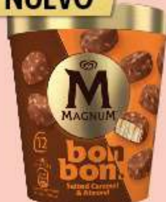
MAGNUM BONBON SALTED CARAMEL & ALMOND Ref.: 64031 8 ud./caja - 204ml - 168g