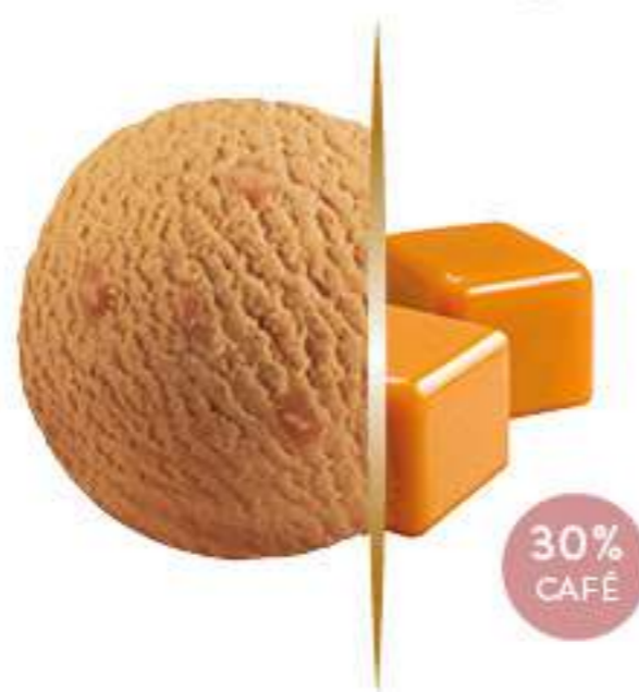
CARAMELO Con trocitos de toffee Ref.: 80806 5500 ml - 2750 g