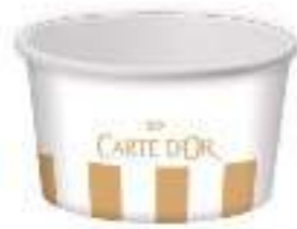
Vasito 175 ml Ref.: 3013