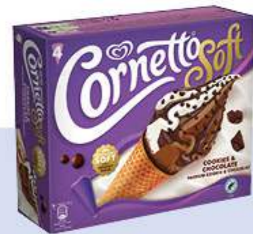
CORNETTO SOFT COOKIES Ref.: 53725 6ud./caja - 560ml - 316g