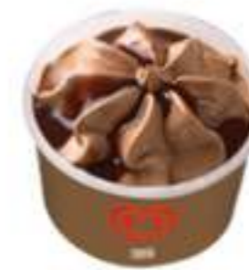
SABOR CAFÉ Ref.: 54294 - 120ml