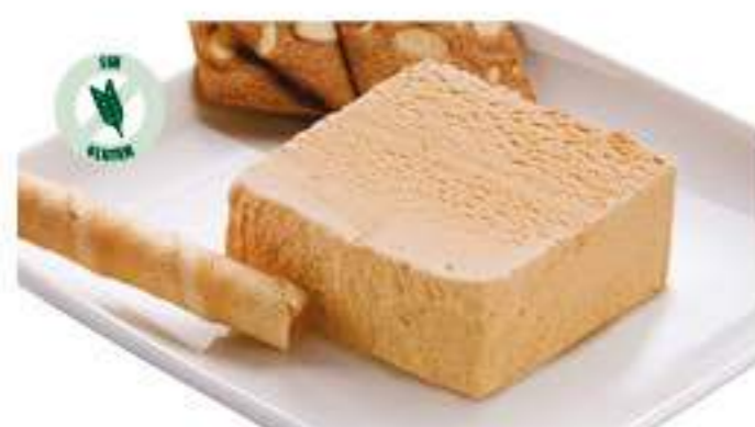
BLOQUE TURRÓN SELECTO 1 Ref.: 002561 1L