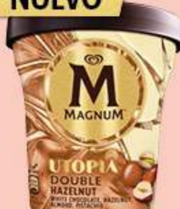
MAGNUM DOBLE HAZELNUT Ref.: 67202 8 ud./caja - 440ml - 310g