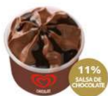
SABOR 2 CHOCOLATES Ref.: 54296 - 120ml