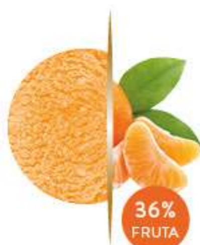
SORBETE MANDARINA Con zumo de mandarina y naranja Ref.: 83470 5500 ml - 3575 g