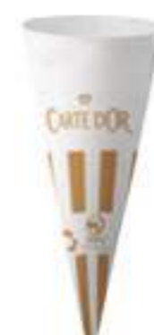
Cono papel Ref.: 3005