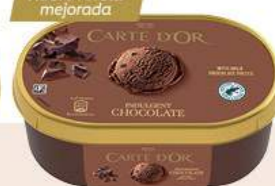
CARTE D'OR CHOCOLATE Ref.: 83082 6 ud./caja - 1000ml - 500 g