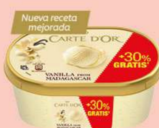
CARTE D'OR VAINILLA 1,3L Ref.: 54478 6 ud./caja 1300 ml - 500 g