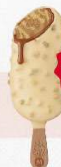
MAGNUM DOUBLE NOCCIOLA Ref.: 66718