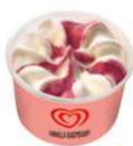
SABOR VAINILLA-FRAMBUESA Ref.: 54285 - 120ml