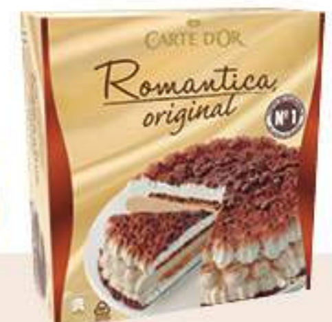
CARTE D'OR TARTA ROMÁNTICA Ref.: 39571 6 ud./caja - 1000 ml - 575 g