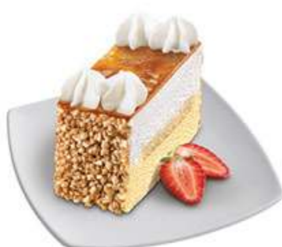
TARTA AL WHISKY RECTANGULAR