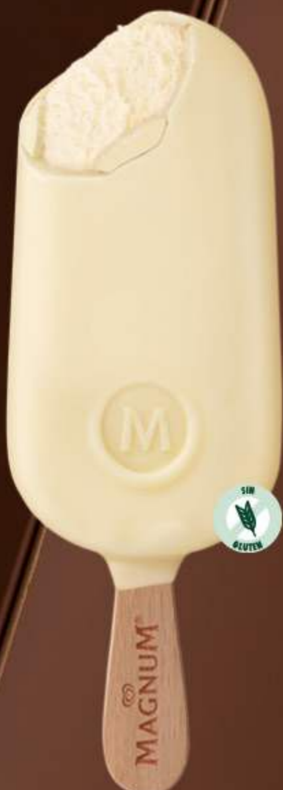
MAGNUM CHOCOLATE BLANCO Ref.: 61297 20 ud./caja - 110ml - 79 g