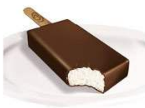
BOMBÓN Ref.: 61927 100ml