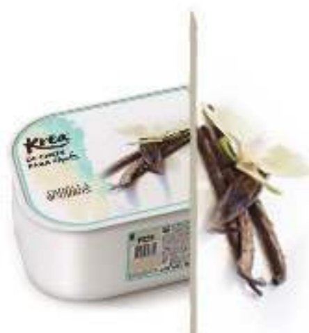
VAINILLA BOURBON 1 Con extracto de vainilla Bourbon de Madagascar Ref.: 00140 - 2,5L

Gama con receta artesana exclusiva para la restauración, con sabores únicos e ingredientes destacados para platos dulces y salados. Alta calidad de su base láctea.