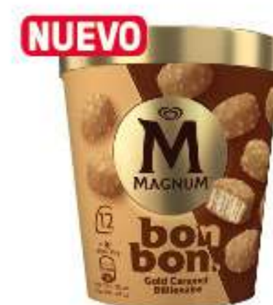
MAGNUM BONBON GOLD CARAMEL BILLIONAIRE Ref.: 63995 12 bombones por tarrina 17 ml por pieza