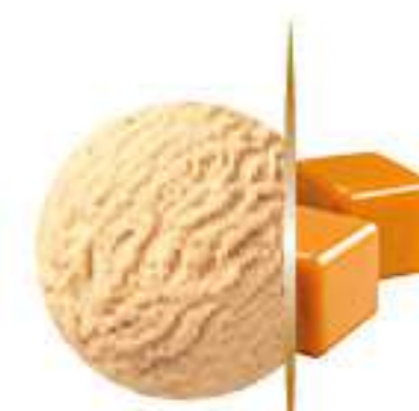
CARAMELO Ref.: 38110 5L