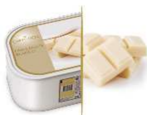
CHOCOLATE BLANCO Ref.: 97613 2,4L