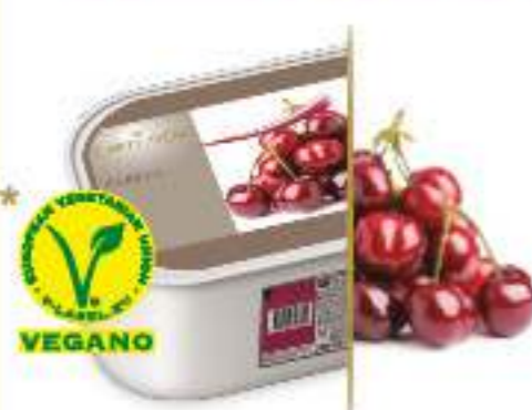
CEREZA Ref.: 59597 2,4L