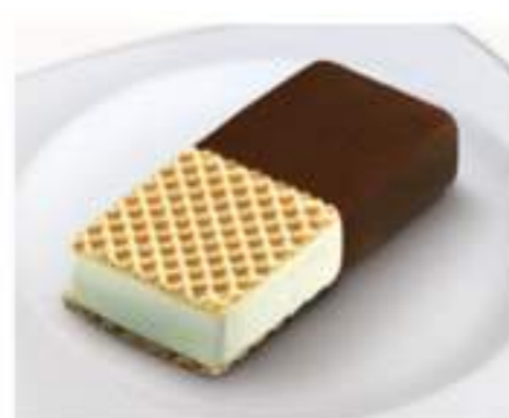
DOMINÓ Ref.: 12159 90ml