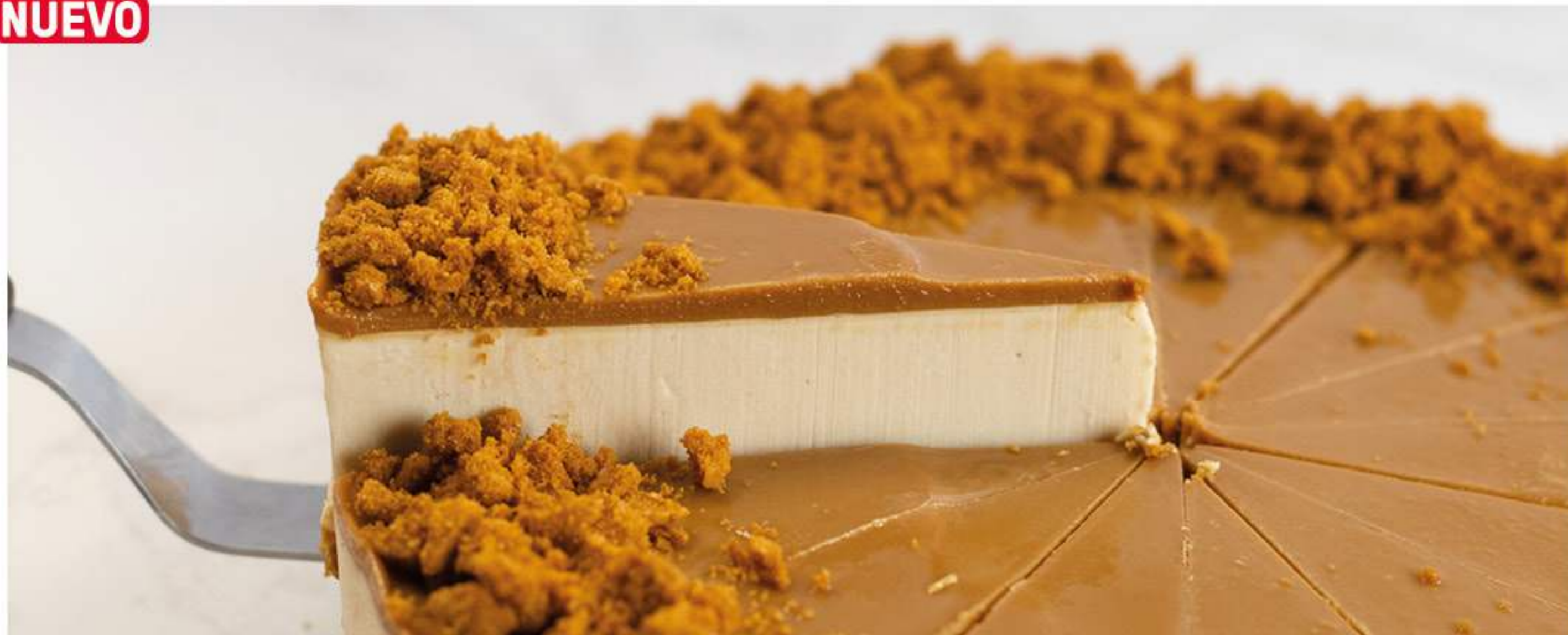
CHEESECAKE DE SPECULOOS CON INGREDIENTES ORIGINALES BISCOFF®