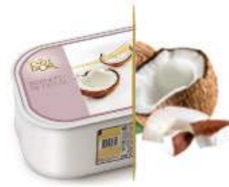
COCO Ref.: 47782 2,4L