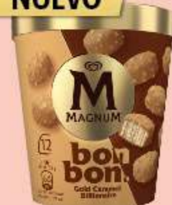
MAGNUM BONBON GOLD CARAMEL BILLIONAIRE Ref.: 63995 8 ud./caja - 204ml - 168g