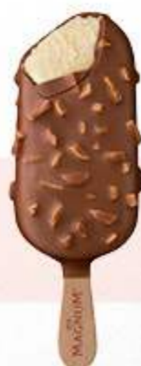
MAGNUM ALMENDRADO Ref.: 60935