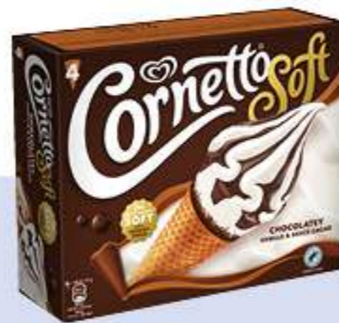
CORNETTO SOFT CHOCOLATE Ref.: 48947 6ud./caja - 560ml - 316g