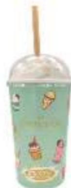
Vaso batido Ref.: 3132 Tapa batido Ref.: 3133