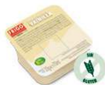
SABOR VAINILLA 1 Ref.: 000439 - 70ml