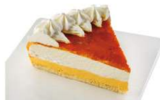
TARTA AL WHISKY CON NATA