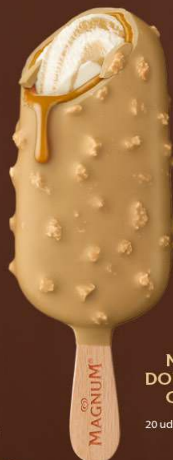
MAGNUM DOUBLE GOLD CARAMEL Ref.: 48054 20 ud./caja - 85 ml - 71 g