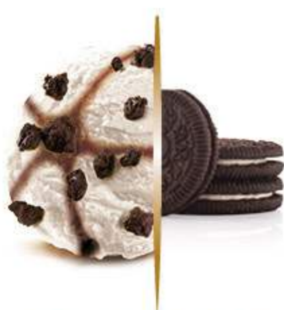
COOKIES&CREAM Helado sabor nata con salsa de chocolate y trocitos de galleta Ref.: 49564 5500 ml - 3212 g