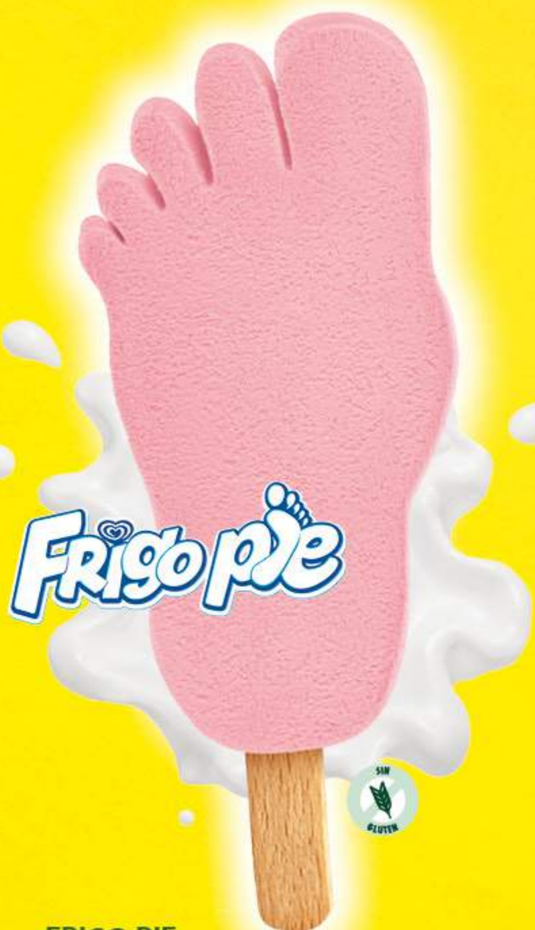
FRIGO PIE Ref.: 70460 25 ud./caja - 79 ml - 40,5 g