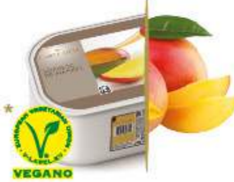
MANGO Ref.: 59632 2,4L