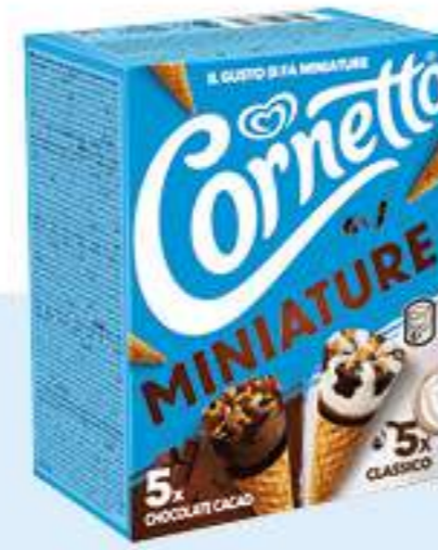
X6 CORNETTO MINIATURA Ref.: 50446 6ud./caja - 280ml - 190g