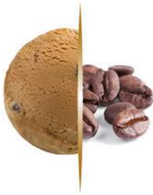
CAFÉ Con caramelos de café recubiertos de chocolate Ref.: 82978 5500 ml - 3000 g