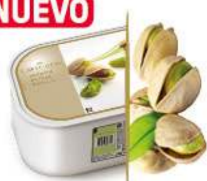
PISTACHO Ref.: 47471 2,4L