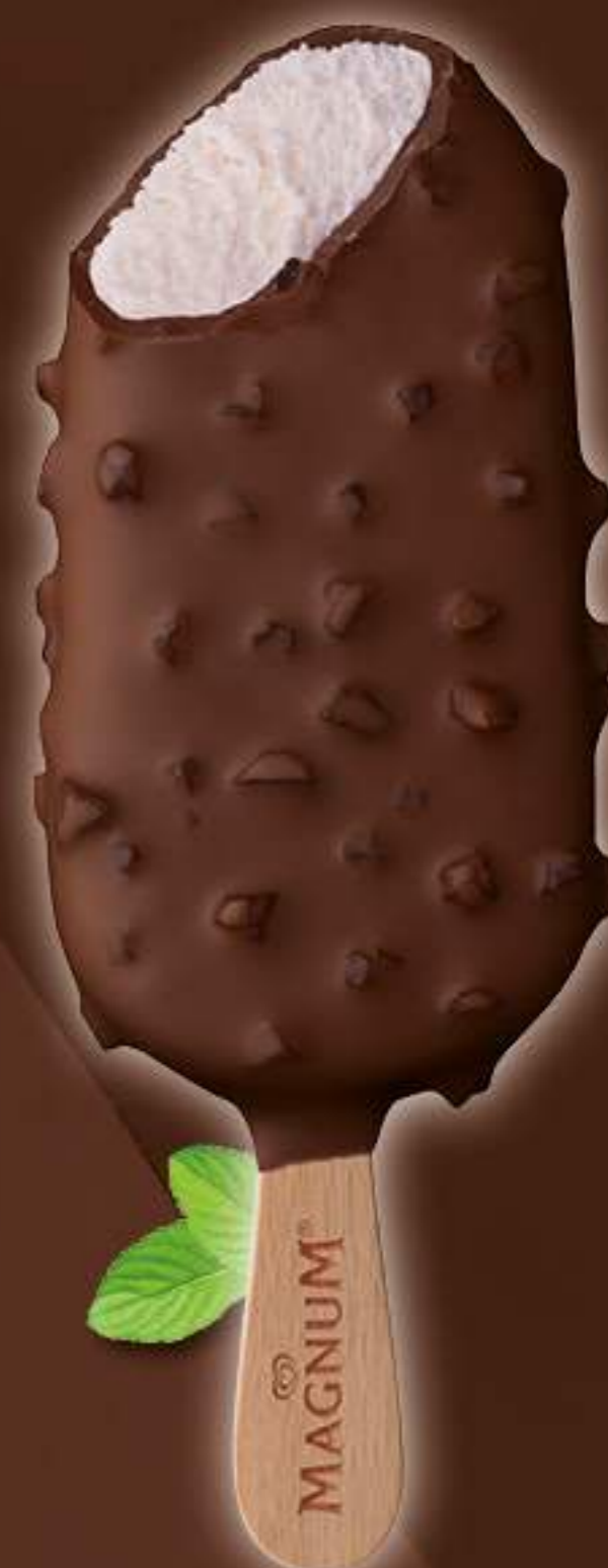
MAGNUM MENTA Ref.: 85701 20ud./caja - 100ml - 78 g