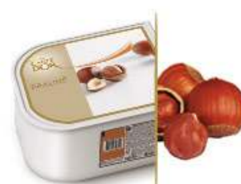
PRALINÉ Ref.: 97694 2,4L