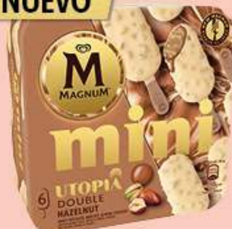
X6 MAGNUM MINI DOBLE HAZELNUT Ref.: 66278 6 ud./caja - 330ml - 276g