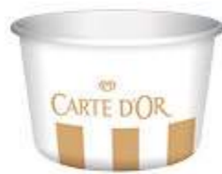
Vasito 200 ml Ref.: 3081