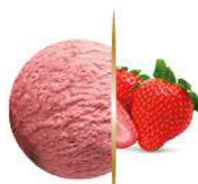
FRESA Ref.: 03241 5L