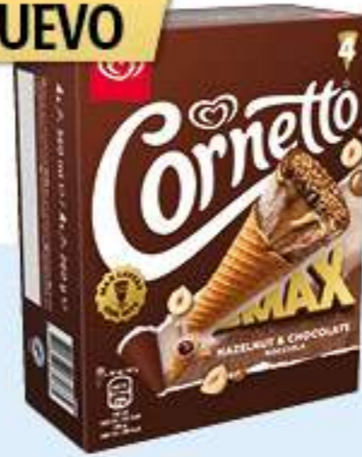
CORNETTO MAX CHOCOLATE Y AVELLANAS - NOCCIOLA Ref.: 68069 6ud./caja - 360ml - 260g