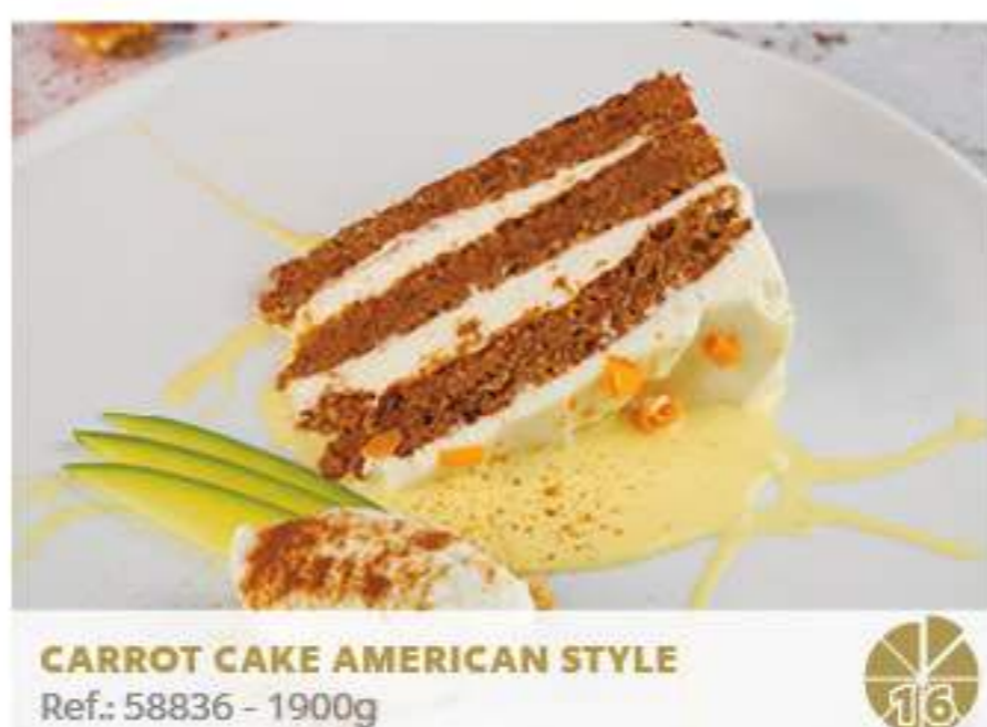
CARROT CAKE AMERICAN STYLE