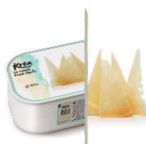
QUESO 1 Ref.: 00149 - 2,5L