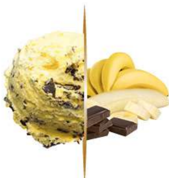
BANANA SPLIT Con crujientes láminas al chocolate Ref.: 92500 5500 ml - 2800g