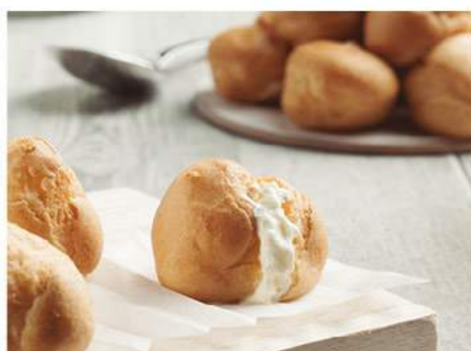
PROFITEROLES 1 Ref.: 58851 - 7 bolsas de 70g