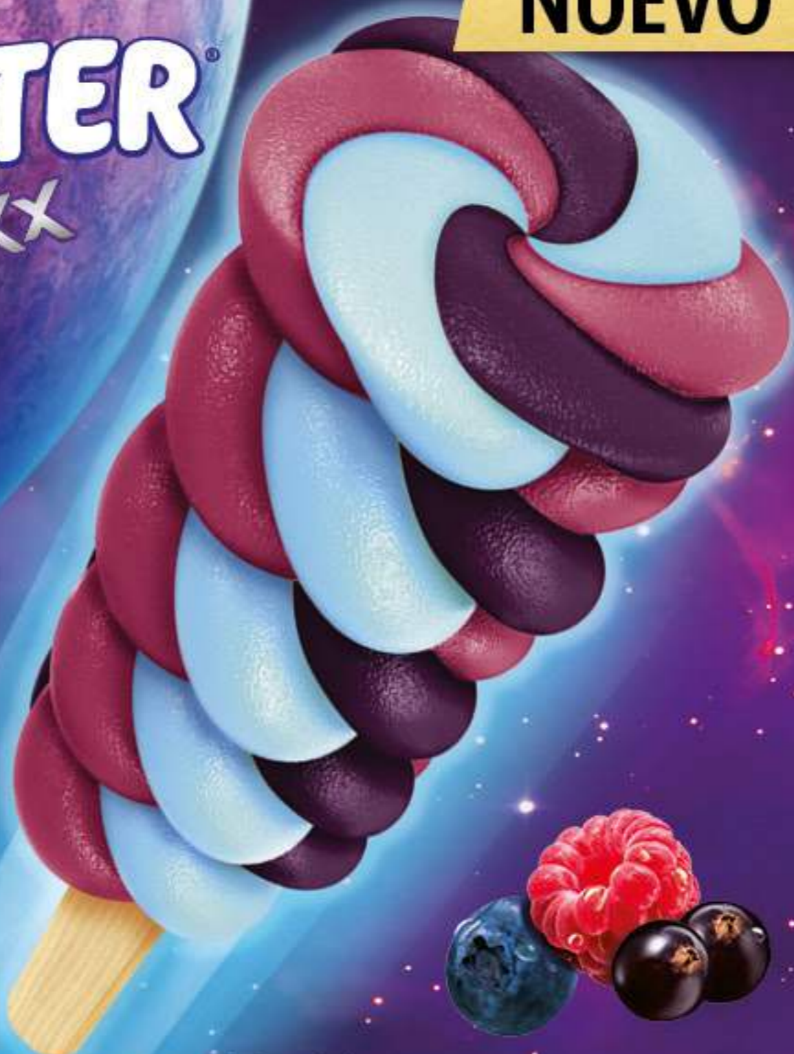
TWISTER COSMIXX Ref.: 62801 35 ud./caja - 70 ml - 72 g