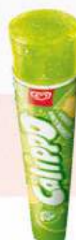
CALIPPO LIMA LIMÓN - Ref.: 40128