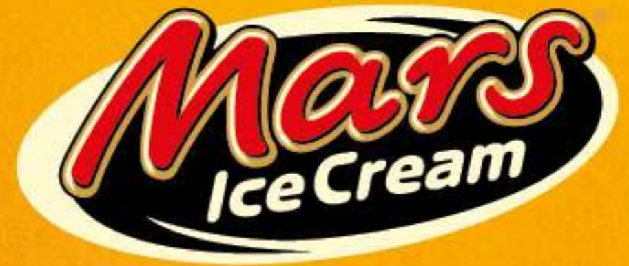
MARS ICE CREAM Ref.: 46085 24 ud./caja-74 ml - 60 g