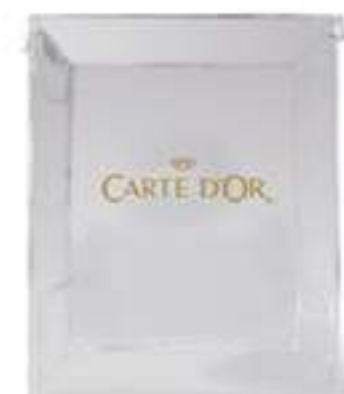
Portaconos metacrilato 8 agujeros Ref.: 3029