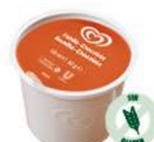
SABOR VAINILLA-CHOCOLATE Ref.: 74427 - 120ml