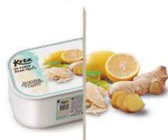
JENGIBRE CONFITADO Y LIMÓN 1 Ref.: 00148 - 2,5L