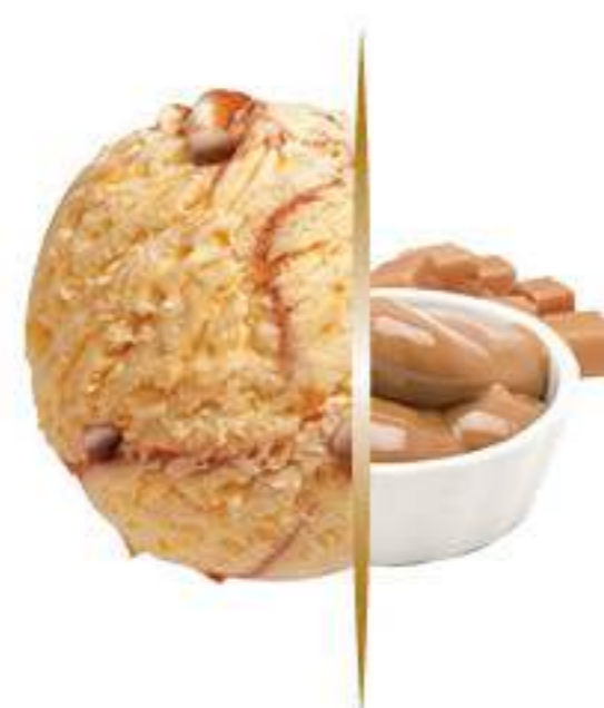
DULCE DE LECHE Con salsa de dulce de leche Ref.: 81308 5500 ml - 3050 g