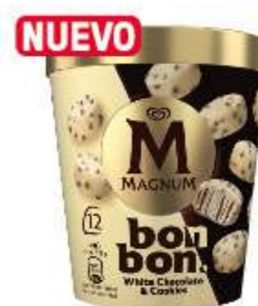
MAGNUM BONBON WHITE CHOCOLATE & COOKIES Ref.: 64046 12 bombones por tarrina 17 ml por pieza