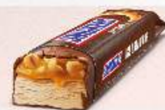
BARRITA SNICKERS Ref.: 46087