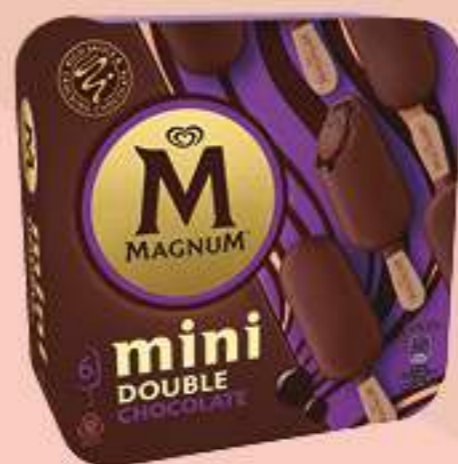
X6 MAGNUM MINI DOBLE CHOCOLATE Ref.: 57835 6 ud./caja - 360ml - 300g