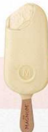
MAGNUM CHOCOLATE BLANCO Ref.: 61297