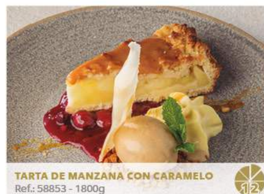
TARTA DE MANZANA CON CARAMELO