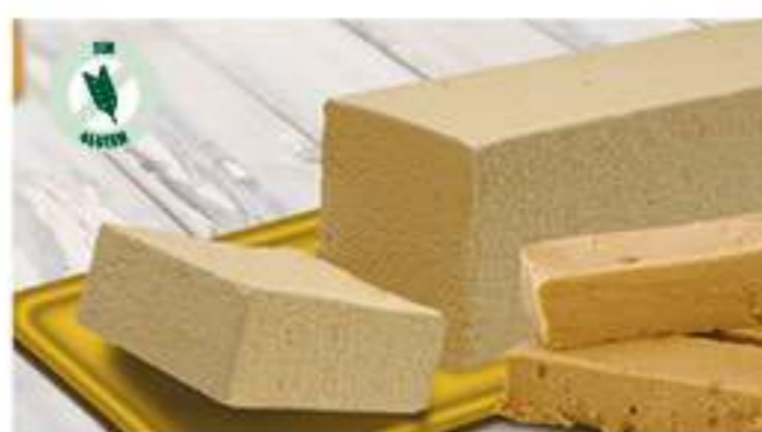
BLOQUE TURRÓN 1 Ref.: 002551 1L