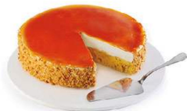
TARTA AL WHISKY Y QUEMADO ARTESANO