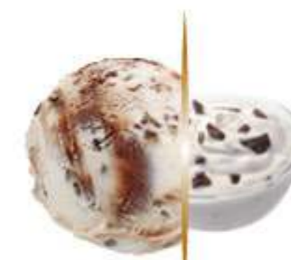
STRACCIATELLA Ref.: 03253 5L

*Elaborado según los estándares veganos, puede contener alérgeno: ver lista de ingredientes.