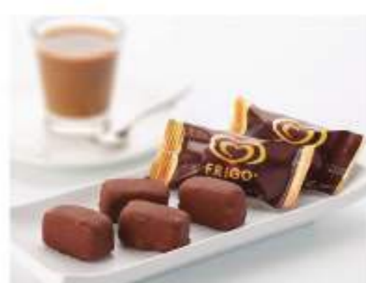
FRIGO MOMENTS Ref.: 63492 120 unidades por caja 12 ml por pieza