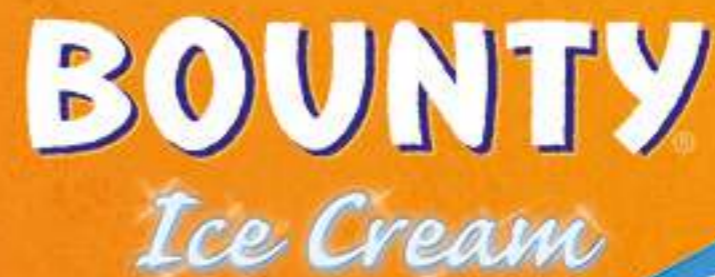
BOUNTY ICE CREAM Ref.: 48303 24ud./caja - 66ml - 51 g