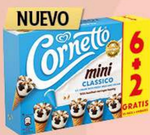
X6 CORNETTO MINI CLASSICO PROMO Ref.: 65652 7 ud./caja 480 ml - 288 g