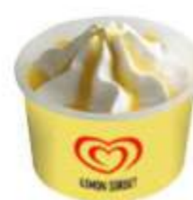
SORBETE LIMÓN Ref.: 63845 - 120ml