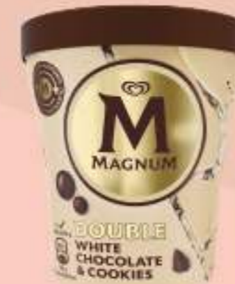
MAGNUM CHOCOLATE BLANCO & COOKIES Ref.: 31563 8 ud./caja - 440 ml - 303,7g