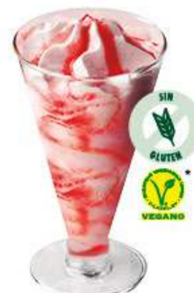
COPA FRESA 1