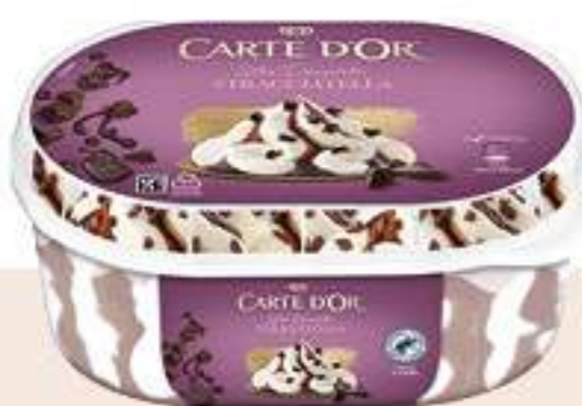
CARTE D'OR STRACCIATELLA Ref.: 62102 6 ud./caja - 825ml - 473 g