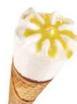
CONO LIMÓN 1 Ref.: 00517 110ml