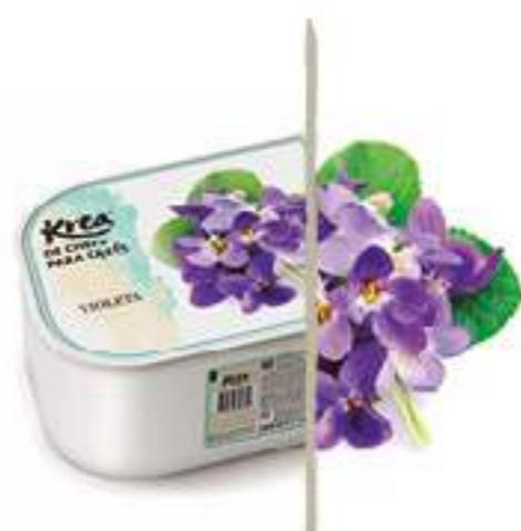
VIOLETA 1 Ref.: 00154 - 2,5L