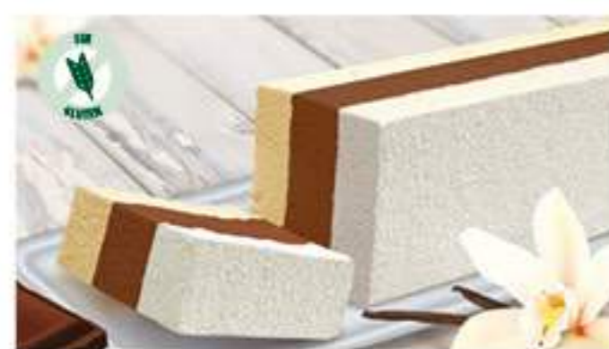
BLOQUE TRES GUSTOS 1 Ref.: 002541 1L