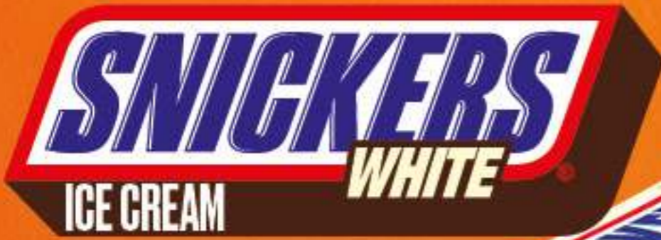
SNICKERS BLANCO ICE CREAM Ref.: 50966 24ud./caja - 60,5ml - 55,3 g