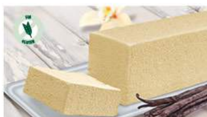
BLOQUE SABOR VAINILLA 1 Ref.: 002511 1L