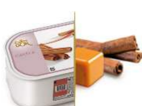
CANELA CON CRUJIENTES DE CARAMELO Ref.: 97563 2,4L