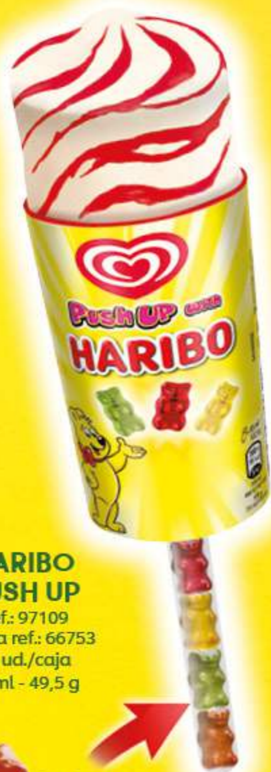
HARIBO PUSH UP Ref.: 97109 Nueva ref.: 66753 30 ud./caja 85 ml - 49,5 g