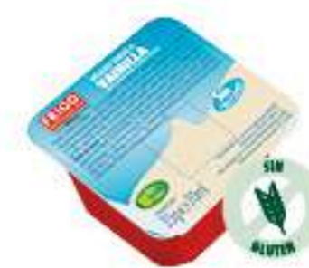
SABOR VAINILLA SIN AZÚCAR 1 Ref.: 000438 - 70ml