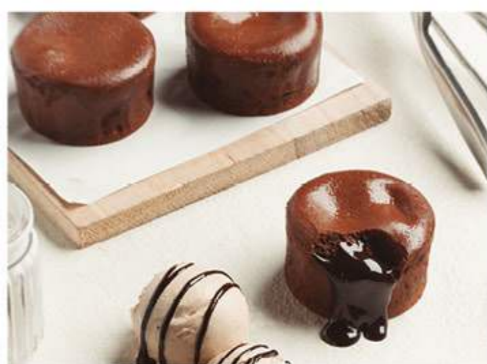
COULANT DE CHOCOLATE 1 Ref.: 62910 - 15 unidades de 100g