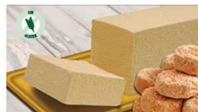
BLOQUE MANTECADO 1 Ref.: 000257 1L