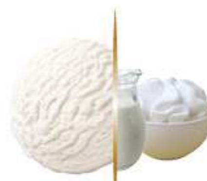
NATA Ref.: 38100 5L