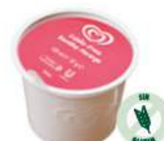
SABOR VAINILLA-FRESA Ref.: 74429 - 120ml