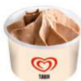
SABOR TURRÓN Ref.: 54303 - 120ml