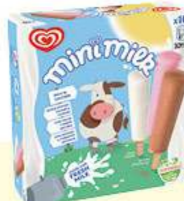
X10 MINIMILK Ref.: 57424 6 ud./caja 350ml - 230 g