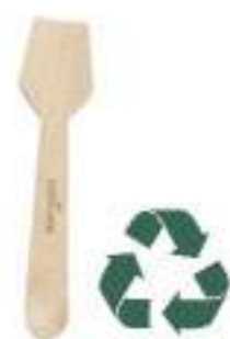
Cucharita madera Ref.: 3101