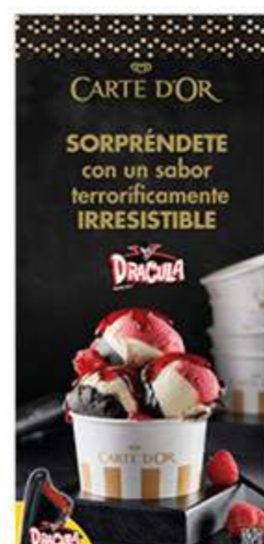
Cartel Especial Kids Carte D'Or Ref.: 7000000994