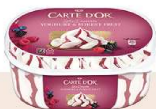
CARTE D'OR YOGUR FRUTAS DEL BOSQUE Ref.: 61958 6 ud./caja - 825ml - 480 g