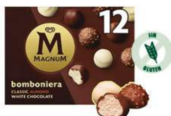
BOMBONIERA Ref.: 61276 12 bombones por pack 12 ml por pieza