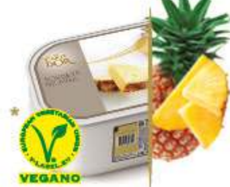
PIÑA TROPICAL Ref.: 59693 2,4L