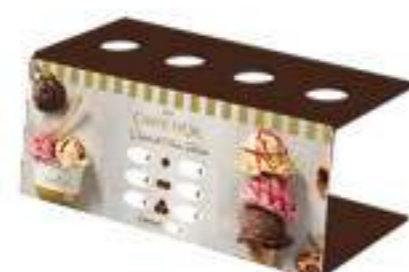
Portaconos Ref.: 41476