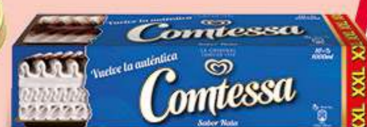
COMTESSA Ref.: 32314 4 ud./caja - 1000 ml - 500 g