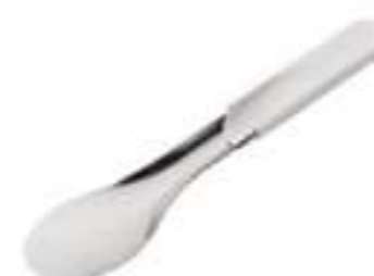
Espátula metálica Ref.: 3095