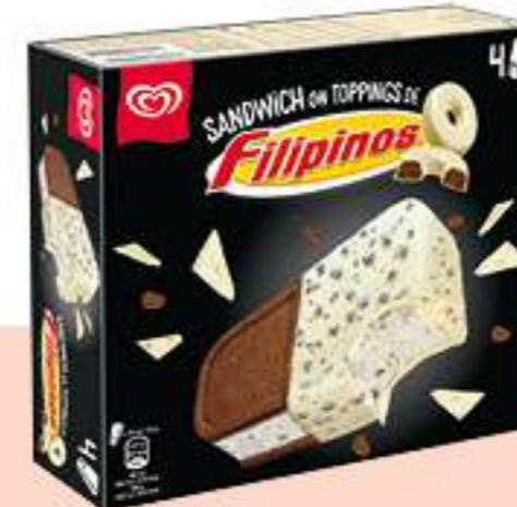
FILIPINOS SÁNDWICH BLANCO Ref.: 59767 6 ud./caja - 520 ml - 308 g