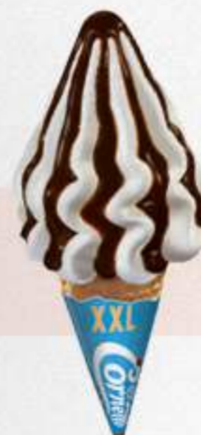
CORNETTO XXL Ref.: 70896