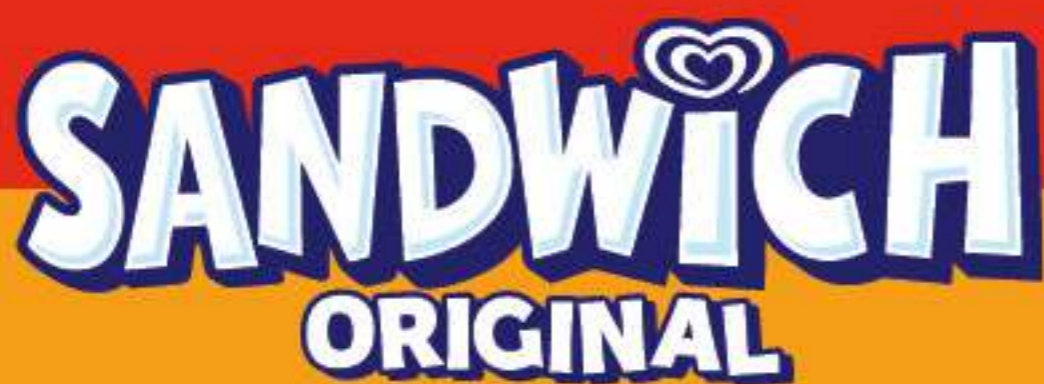
SÁNDWICH SABOR NATA Ref.: 00215 42 ud./caja-100 ml - 67 g