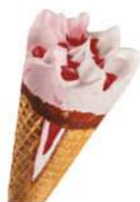
CONO NATA FRESA 1 Ref.: 00522 110ml