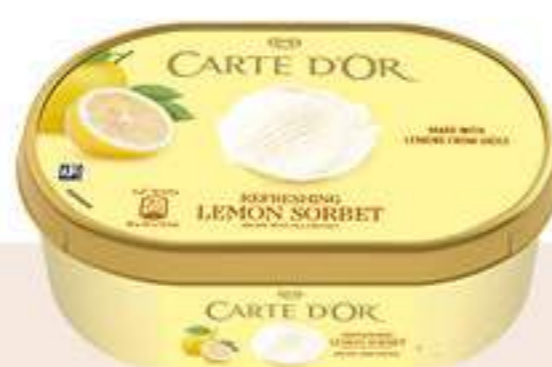
CARTE D'OR SORBETE LIMÓN Ref.: 63719 6 ud./caja - 1000ml - 500 g