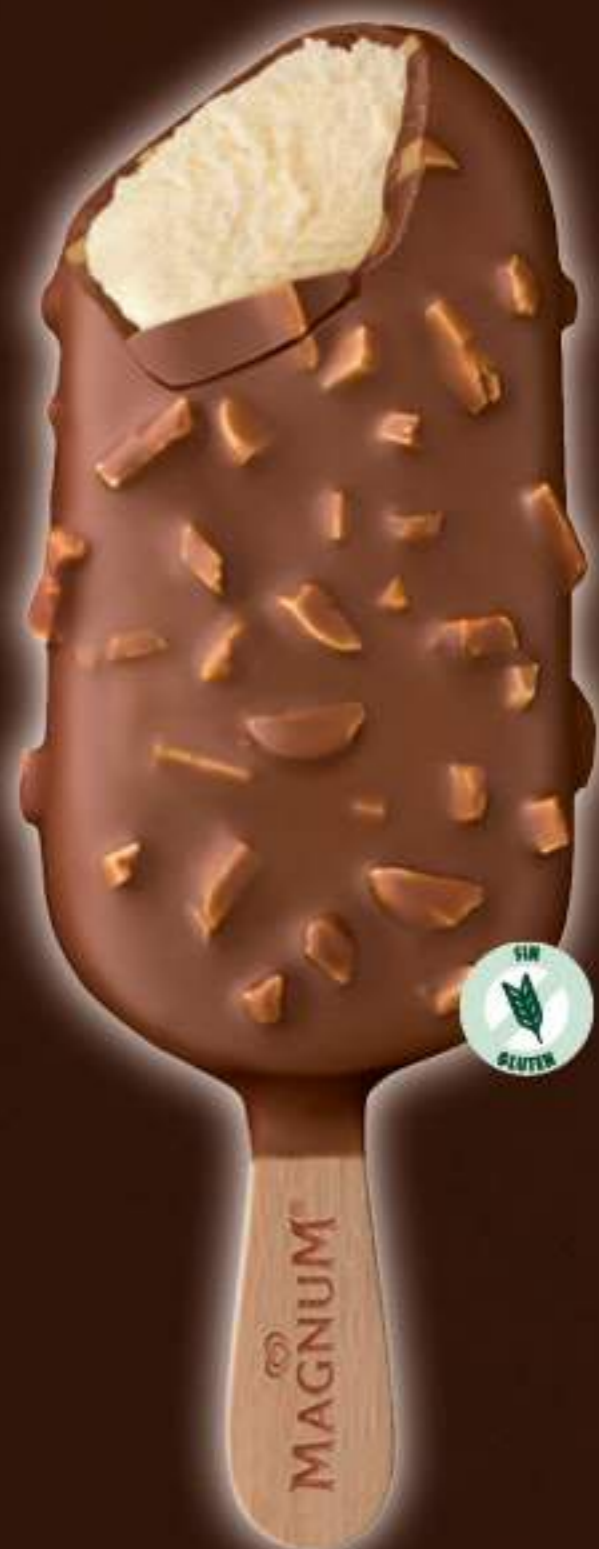
MAGNUM ALMENDRADO Ref.: 60935 20 ud./caja - 110ml - 83 g