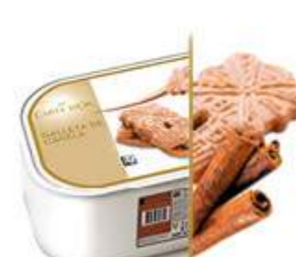
GALLETA SPÉCULOOS Ref.: 71710 2,4L