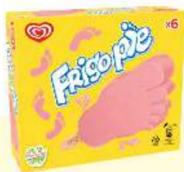
X6 FRISOPIE Ref.: 92655 6 ud./caja 474 ml - 243 g