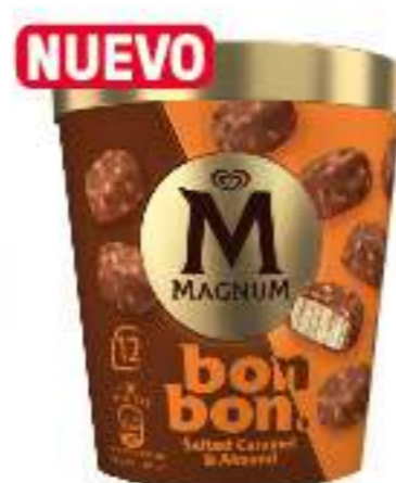
MAGNUM BONBON SALTED CARAMEL & ALMOND Ref.: 64031 12 bombones por tarrina 17 ml por pieza