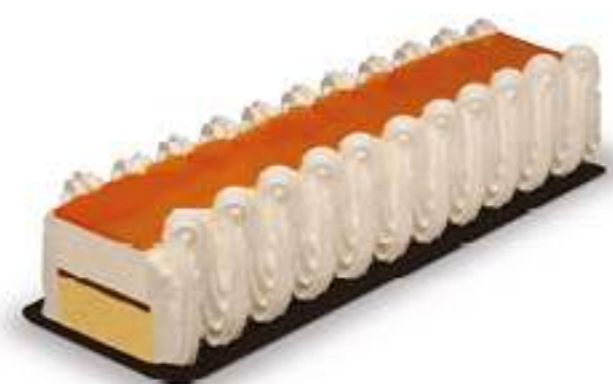
TARTA AL WHISKY MENÚ 1