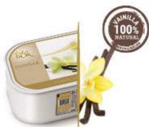
VAINILLA DE MADAGASCAR Ref.: 47401 2,4L