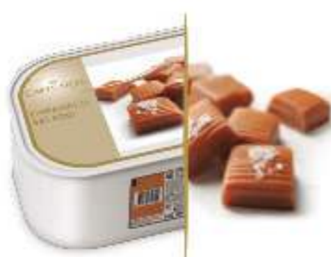
CARAMELO SALADO Ref.: 46694 2,4L