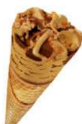
CONO TURRÓN 1 Ref.: 00515 110ml