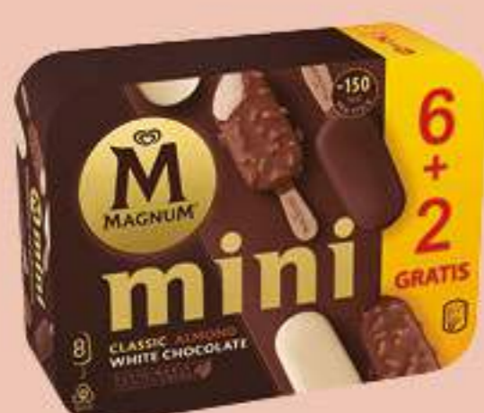
X8 MAGNUM MINI SURTIDO PROMO Ref.: 61089 6 ud./caja - 440 ml - 352 g

Consumo de Llevar a casa, venta incremental