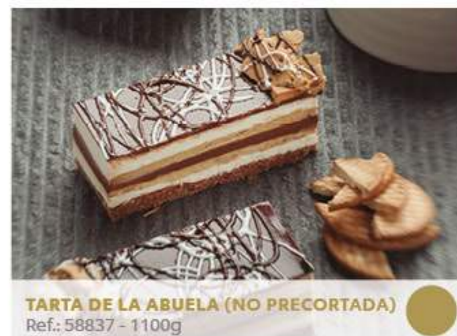
TARTA DE LA ABUELA (NO PRECORTADA)