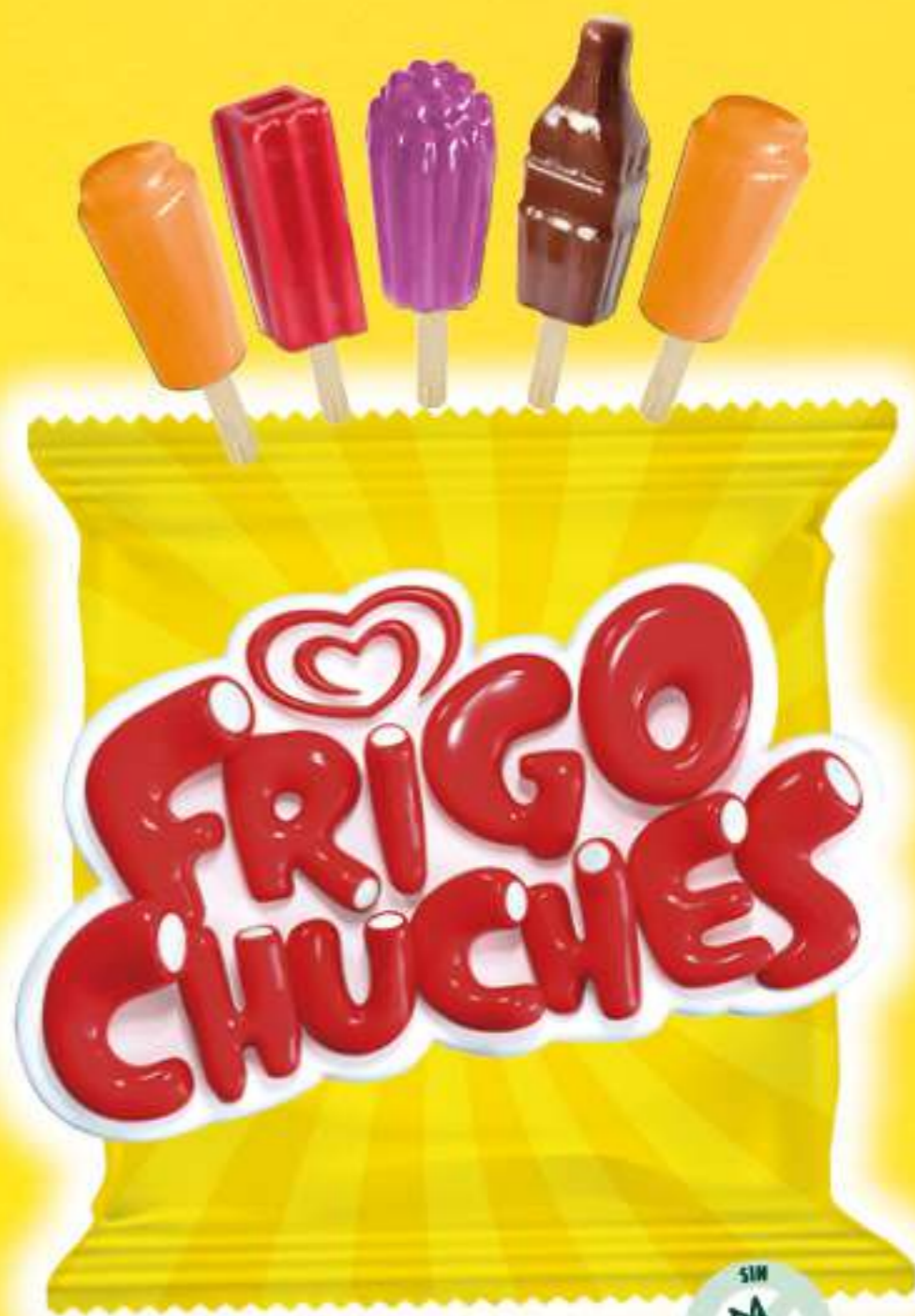
FRIGO CHUCHES Ref.: 63498 20 ud./caja - 85 ml - 87 g