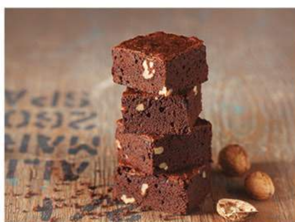
BROWNIE CON NUECES 1 Ref.: 58842 - Plancha 1700g / 24 unidades