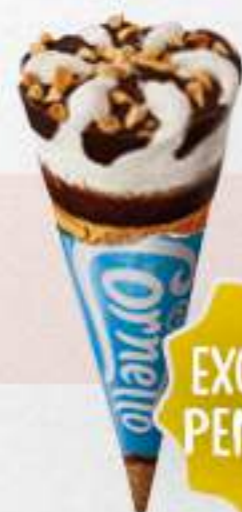
CORNETTO CLASSIC Ref.: 31967 Nueva ref.: 65353