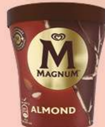
MAGNUM ALMENDRADO Ref.: 56323 8 ud./caja - 440ml - 297g