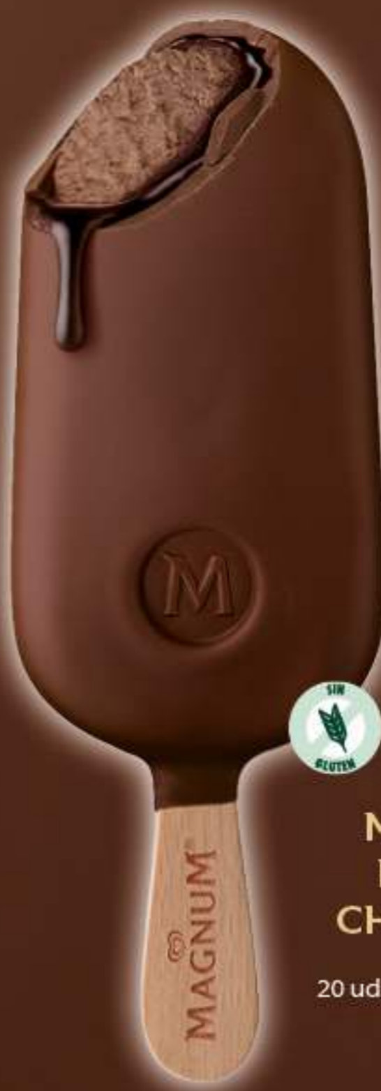
MAGNUM DOUBLE CHOCOLATE Ref.: 57798 20 ud./caja - 85 ml - 71 g