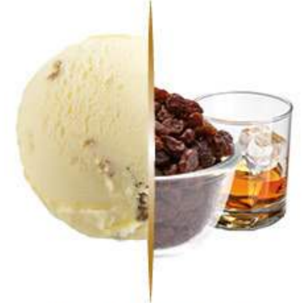
RON Y PASAS Con sabor a ron Ref.: 81599 5500 ml - 2750 g