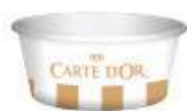
Vasito 80 ml Ref.: 3098