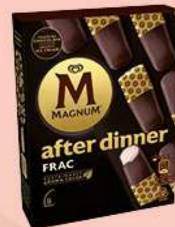
X8 MAGNUM AFTER DINNER FRAC Ref.: 62539 8 ud./caja - 280ml - 232g