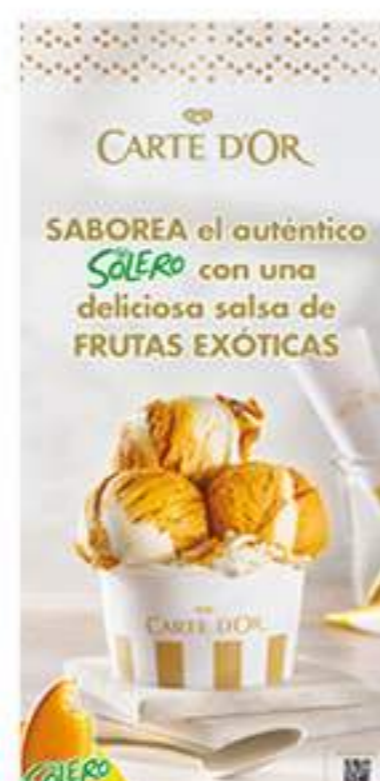
Cartel Novedades Carte D'Or Ref.: 41639