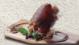
Codillo cerdo alemán 600gr.