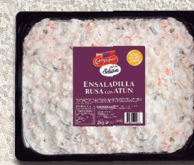
Ensaladilla rusa con atún