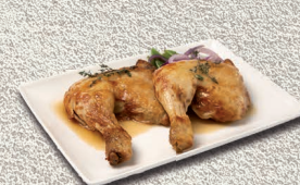
Cuartos traseros pollo asado