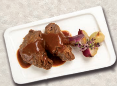
Carrillada en salsa 1,9kg.