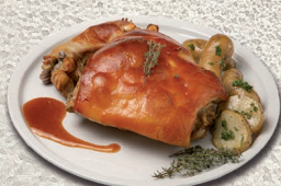
Cuarto de cochinitillo preasado