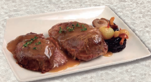
Carilleras de cerdo al horno