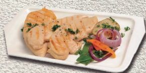
Pechugas de pollo asadas