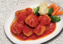
Albóndigas con tomate 2kg.