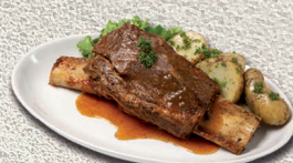
Costilla ternera baja temp. 500gr.