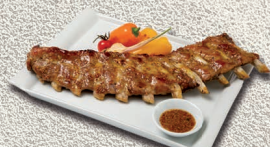
Costillar mostaza y miel ±600gr.