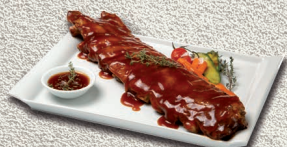
Costillar barbacoa ±650gr.