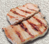
Lomo de cerdo asado