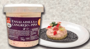
Cocktail de cangrejo y piña