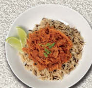
Pulled pork BBQ 500gr.