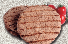
Hamburguesa de vacuno asada 90gr.