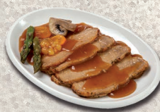
Lomo de cerdo en salsa