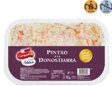
Sin glutamato Pintxo a la Donostiarra CAMPOFRÍO 32816 1 kg 6 Ud. Caja