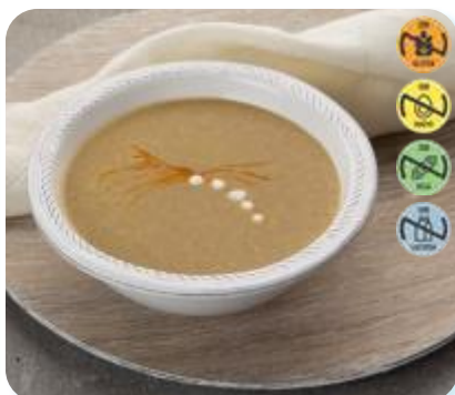
Triturado Cerdo, Zanahoria y Lentejas 22663 2,5 kg 3 Ud. Caja HEALTH CARE