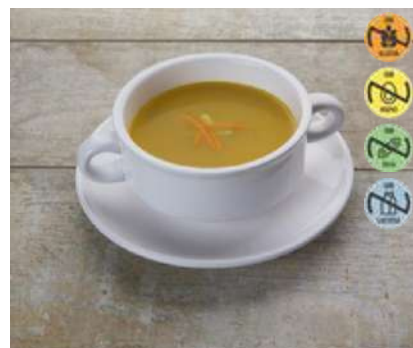
Caldo Concentrado 26746 Jamón y Hortalizas 1 kg CAMPOFRÍO 4 Ud. Caja