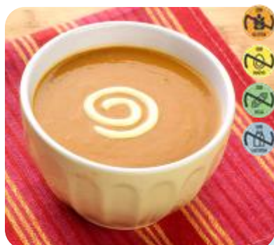
Triturado Fideuá HEALTH CARE 25932 2,5 kg 3 Ud. Caja