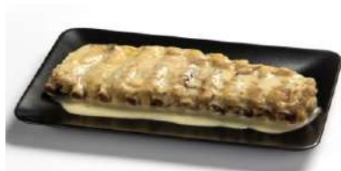
Costillar Salsa CAMPOFRÍO 34049 0,6 kg 12 Ud. Caja