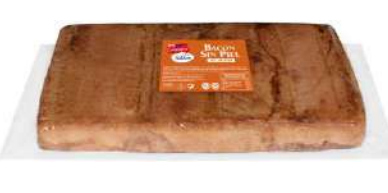
Bacon sin Piel 32429 5 kg 3 Ud. Caja CAMPOFRÍO