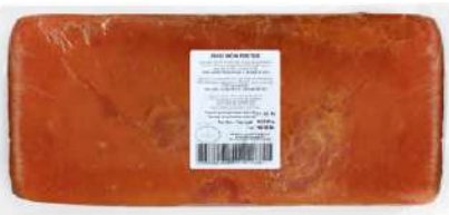
Bacon Práctico 8492 4,33 kg 3 Ud. Caja CAMPOFRÍO