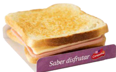
Sándwich 34262 Jamón y Queso 145 kg CAMPOFRÍO 13 Ud. Caja