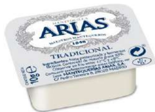
Tarrina Mantequilla ARIAS 710545 10 g 100 Ud. Caja