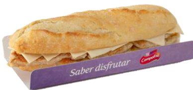
Bocadillo Pollo 34258 y Queso 267 g CAMPOFRÍO 13 Ud. Caja