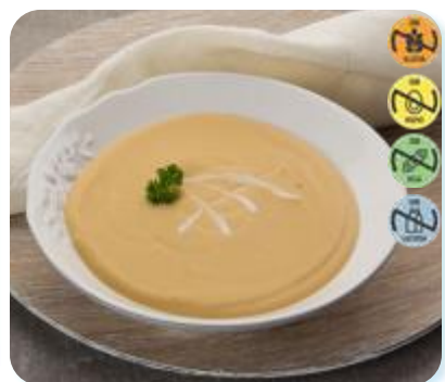
Triturado Pescado Blanco, Zanh y Arroz 22668 2,5 kg 3 Ud. Caja HEALTH CARE