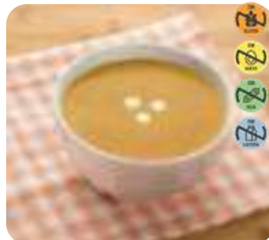
Triturado Paella HEALTH CARE 28947 2,5 kg 3 Ud. Caja