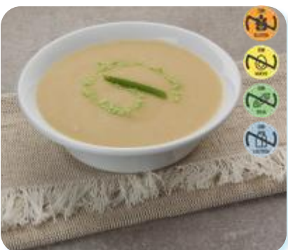
Triturado Cerdo, Jud. Verde y Zanh 24011 2,5 kg 3 Ud. Caja HEALTH CARE