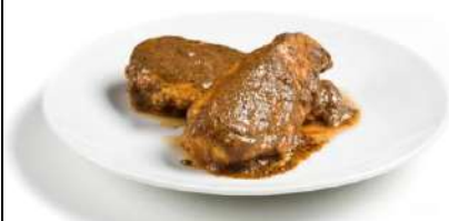
Pechuga de Pollo en Salsa CAMPOFRÍO 34255 1 kg 4 Ud. Caja