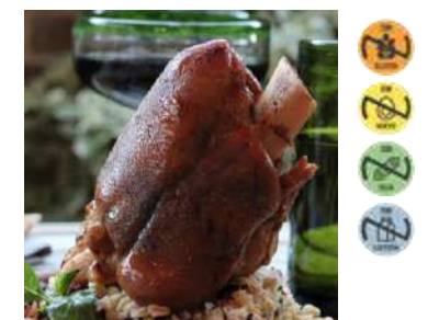
710560 Codillo de Cerdo Alemán Tulip 600 g CAMPOFRÍO 12 Ud. Caja