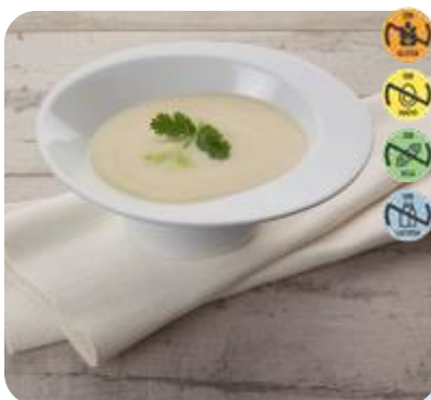
Crema Esparragos 26739 2,5 kg 3 Ud. Caja HEALTH CARE