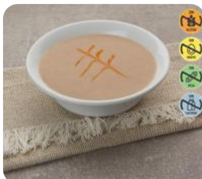
Triturado Ternera, Hortalizas, Arroz 26559 2,5 kg 3 Ud. Caja HEALTH CARE