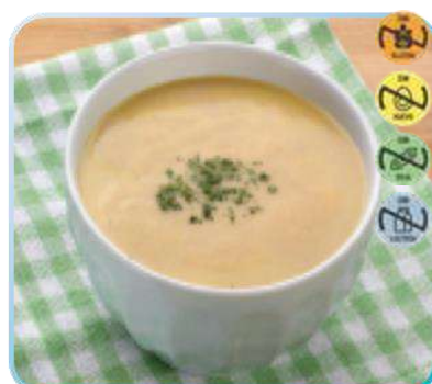
Triturado Cocido HEALTH CARE 25925 2,5 kg 3 Ud. Caja