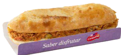
Bocadillo Atún y 34267 Pimientos 275 g CAMPOFRÍO 13 Ud. Caja