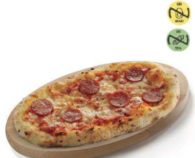
Pizzella Pepperoni CAMPOFRÍO