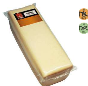
Queso Mezcla Tierno 29144 Barra 3,25 kg NAVIDUL 2 Ud. Caja