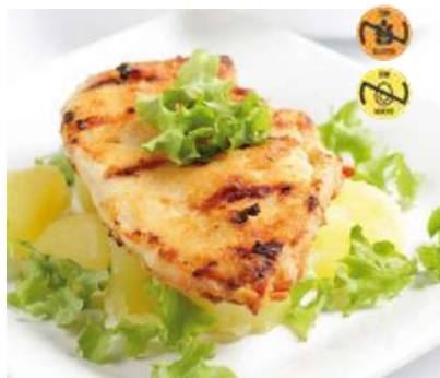
12110 Filete Pechuga 1 kg Pollo Plancha 6 Ud. Caja CAMPOFRÍO +/- 14 Ud. Barq.