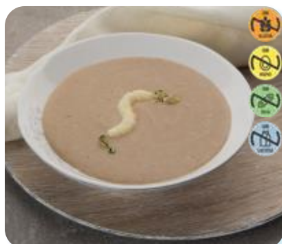
Triturado Tern., Calabacín y Patata 23999 2,5 kg 3 Ud. Caja HEALTH CARE