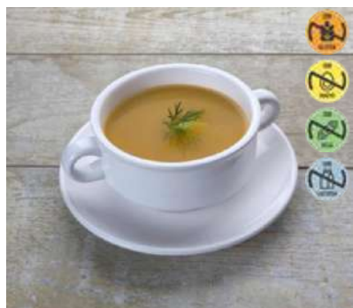
Caldo Concentrado Pescado CAMPOFRÍO 26744 1 kg 4 Ud. Caja