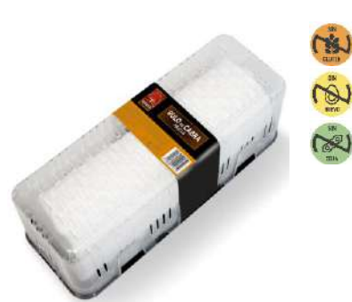
Queso Mezcla 29175 Rulo 1 kg NAVIDUL 2 Ud. Caja