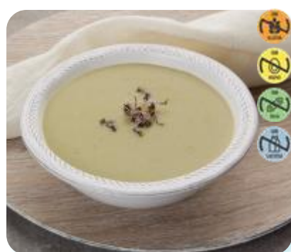
Triturado Merluza, Jud. Verde, Calab 24012 2,5 kg 3 Ud. Caja HEALTH CARE