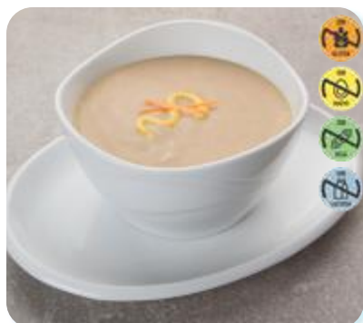
Triturado Pollo, Zanahoria, Judía y Patata 26558 2,5 kg 3 Ud. Caja HEALTH CARE