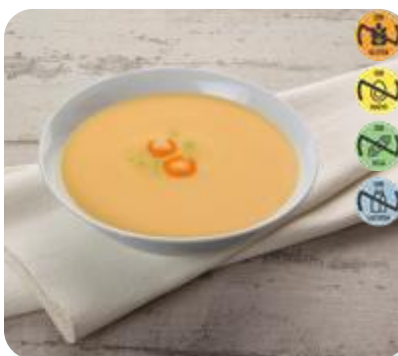
Crema Calabaza 26742 2,5 kg 3 Ud. Caja HEALTH CARE