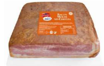
Bacon Molde sin Piel 1/2 Pieza 27709 2,1 kg 4 Ud. Caja CAMPOFRÍO