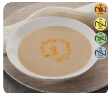
Triturado Pollo, Judía Verde y Arroz 24000 2,5 kg 3 Ud. Caja HEALTH CARE