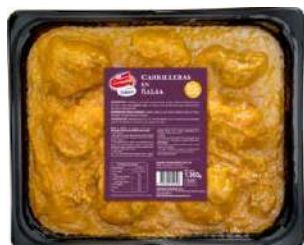
Carrilleras en Salsa CAMPOFRÍO 34160 1,9 kg 2 Ud. Caja