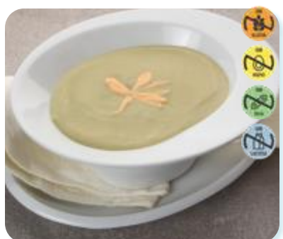
Triturado Merluza y Hortalizas 26622 2,5 kg 3 Ud. Caja HEALTH CARE