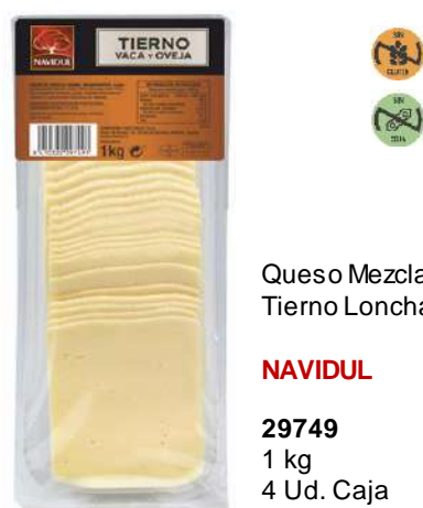
Queso Mezcla Tierno Lonchas