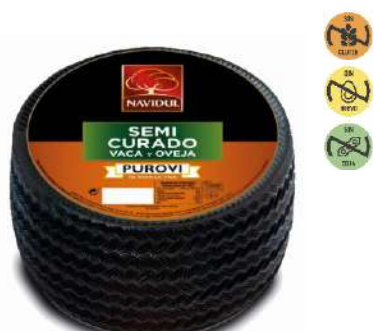
Queso Mezcla 8904 Semicurado 3,5 kg NAVIDUL 2 Ud. Caja