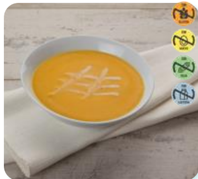
Crema Zanahoria 26740 2,5 kg 3 Ud. Caja HEALTH CARE