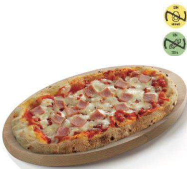
Pizzella Prosciutto CAMPOFRÍO