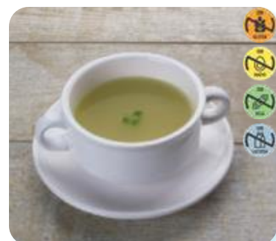
Caldo Vegetales CAMPOFRÍO 27966 1 kg 4 Ud. Caja