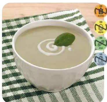
Triturado Merluza HEALTH CARE 28948 2,5 kg 3 Ud. Caja