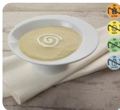
Crema Puerros 26741 2,5 kg 3 Ud. Caja HEALTH CARE