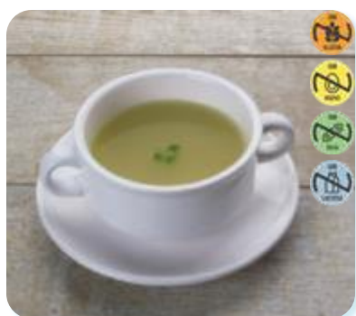
Caldo 27966 Vegetales 1 kg CAMPOFRÍO 4 Ud. Caja