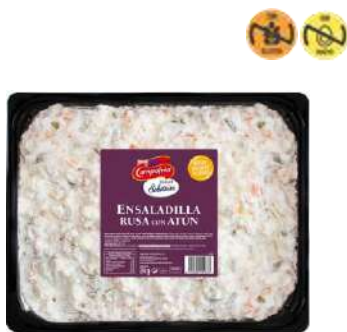
Ensaladilla Rusa C/ Atún CAMPOFRÍO 22967 2 kg 2 Ud. Caja