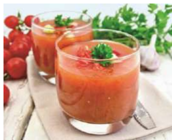
Gazpacho 33748 Health Care 1,5 L CAMPOFRÍO x Ud. Caja