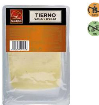
Queso Mezcla Tierno 29145 Lonchas 300 g NAVIDUL 5 Ud. Caja