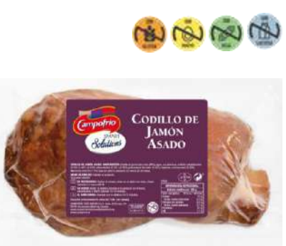
27503 Codillo de Jamón Asado 0,3 kg CAMPOFRÍO 8 Ud. Caja