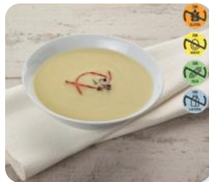
Crema Hortalizas 26743 2,5 kg 3 Ud. Caja HEALTH CARE