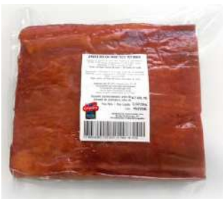
Bacon Práctico Mitades 24883 2 kg 4 Ud. Caja CAMPOFRÍO