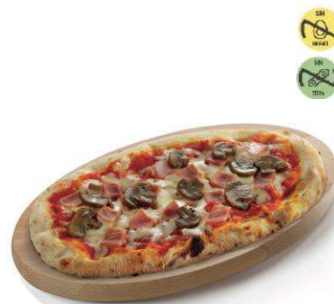
Pizzella Prosciutto e Funghi CAMPOFRÍO