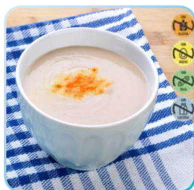
Triturado Fabada HEALTH CARE 25926 2,5 kg 3 Ud. Caja