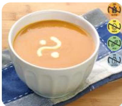
Triturado Magro Riojana HEALTH CARE 25933 2,5 kg 3 Ud. Caja