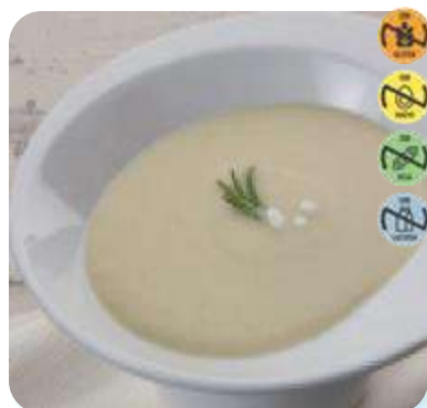
Crema de Champiñon 26738 2,5 kg 3 Ud. Caja HEALTH CARE