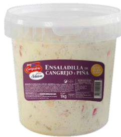
Ensaladilla Cangrejo y Piña CAMPOFRÍO 29010 1 kg 4 Ud. Caja