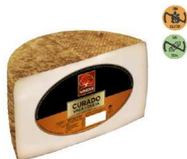
Queso Mezcla 33365 Curado 1,5 kg NAVIDUL 4 Ud. Caja