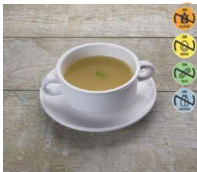
Caldo Concentrado Ave CAMPOFRÍO 26745 1 kg 4 Ud. Caja