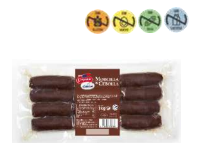
30535 Morcilla con Cebolla 1 kg CAMPOFRÍO 4 Ud. Caja