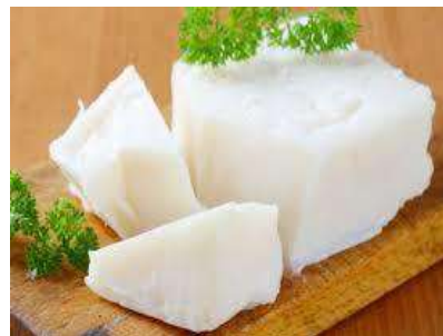
Manteca Fundida 602 Cerdo 20 kg CAMPOFRÍO 1 Ud. Caja