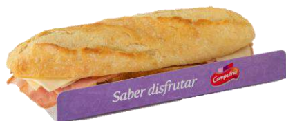
Bocadillo Bacon 34257 Y Queso 235 g CAMPOFRÍO 13 Ud. Caja