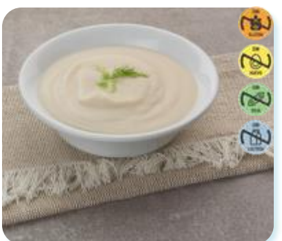
Triturado Pollo, Calabacín y Patata 22669 2,5 kg 3 Ud. Caja HEALTH CARE