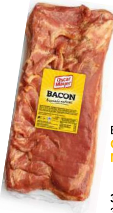
Bacon Corte OSCAR MAYER