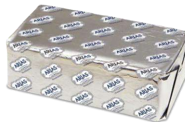
Mantequilla ARIAS 710546 1 kg 6 Ud. Caja