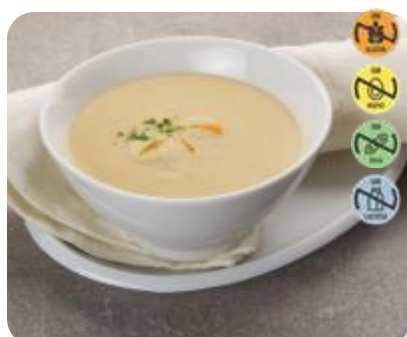
Triturado Pesc. Blc, Calab., Zanh. y Patata 26621 2,5 kg 3 Ud. Caja HEALTH CARE