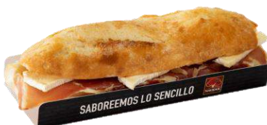
Bocadillo 34268 Jamón Curado 275 g y Brie 13 Ud. Caja NAVIDUL