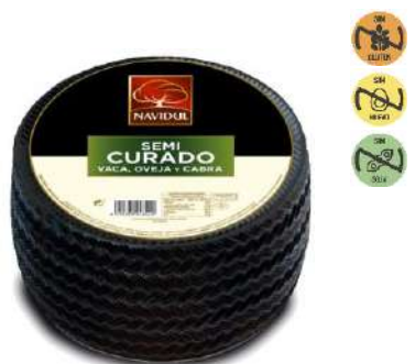
Queso Mezcla 3 24884 Leches Semicurado 3 kg NAVIDUL 2 Ud. Caja