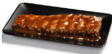
Costillar BBQ CAMPOFRÍO 34050 0,6 kg 12 Ud. Caja