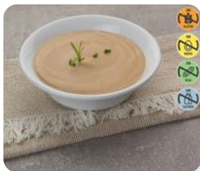
Triturado Pavo, Calabacín y Patata 22665 2,5 kg 3 Ud. Caja HEALTH CARE