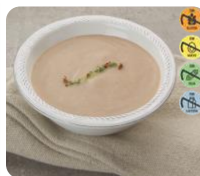
Triturado Ternera y Hortalizas 26618 2,5 kg 3 Ud. Caja HEALTH CARE