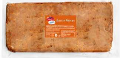
Bacon Molde "B" 854 4,1 kg 2 Ud. Caja CAMPOFRÍO