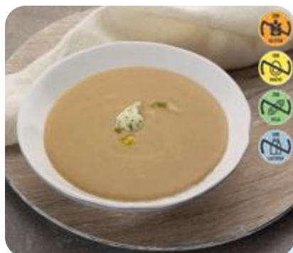
Triturado Ternera, Zanh y Garbanzos 22662 2,5 kg 3 Ud. Caja HEALTH CARE