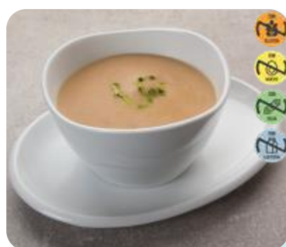
Triturado Pollo, Judía Verde y Patata 26619 2,5 kg 3 Ud. Caja HEALTH CARE