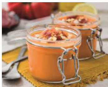
Salmorejo 33749 Health Care 1,5 L CAMPOFRÍO x Ud. Caja