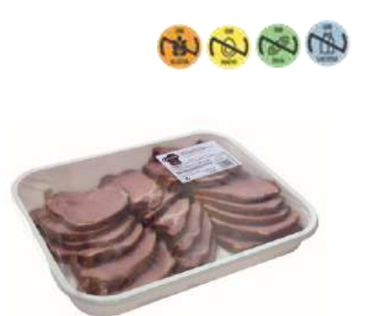
8029 Chuleta Sajonia 2,2 kg CAMPOFRÍO 3 Ud. Caja