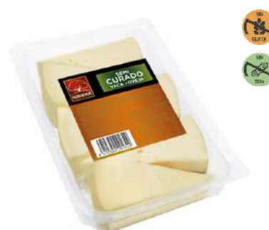
Queso Mezcla 29172 Semicurado Lonchas 500 g NAVIDUL 8 Ud. Caja