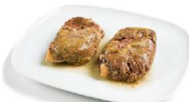
Carrillada CAMPOFRÍO 34266 0,75 kg 6 Ud. Caja