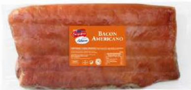
Bacon estilo Americano 8489 4,3 kg 3 Ud. Caja CAMPOFRÍO