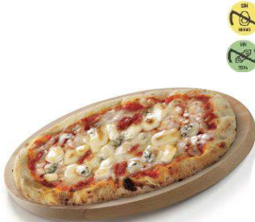
Pizzella 4 Formaggi CAMPOFRÍO