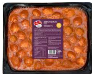
Albóndigas con Tomate CAMPOFRÍO 34265 2 kg 2 Ud. Caja