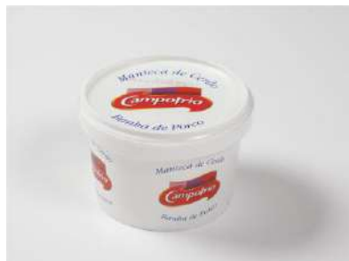
Manteca Fundida 604 Cerdo 0,485 kg CAMPOFRÍO 12 Ud. Caja