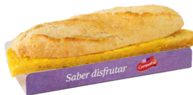
Bocadillo Tortilla 34272 Patata 315 g CAMPOFRÍO 13 Ud. Caja