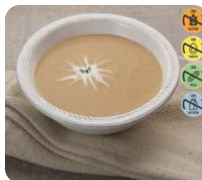
Triturado Cerdo y Hortalizas 26560 2,5 kg 3 Ud. Caja HEALTH CARE