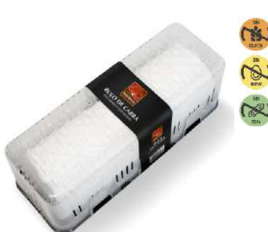
Queso Rulo de 26063 Cabra 1 kg NAVIDUL 2 Ud. Caja