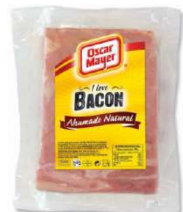
Bacon Ahumado Natural Pieza 28195 1,35 kg 6 Ud. Caja OSCAR MAYER