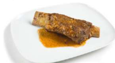
Costilla en Salsa CAMPOFRÍO 34181 1 kg 6 Ud. Caja