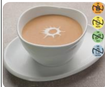
Triturado Pavo, Zanh., Calab. y Patata 26561 2,5 kg 3 Ud. Caja HEALTH CARE