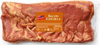
Bacon al Vacío 142 3,45 kg 2 Ud. Caja CAMPOFRÍO