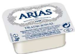
Tarrina Mantequilla ARIAS 710544 8 g 300 Ud. Caja