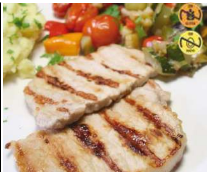
12115 Lomo Cerdo 1 kg Asado Loncheado 6 Ud. Caja CAMPOFRÍO +/- 20 Ud. Barq.