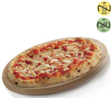
Pizzella Margarita CAMPOFRÍO