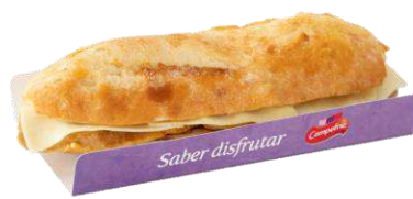
Bocadillo Lomo 34260 Adobado y Queso 232 g CAMPOFRÍO 13 Ud. Caja