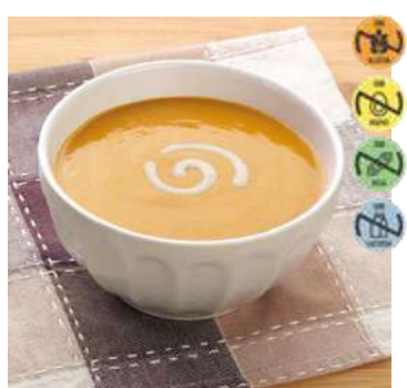
Triturado Estofado Ternera HEALTH CARE 28950 2,5 kg 3 Ud. Caja