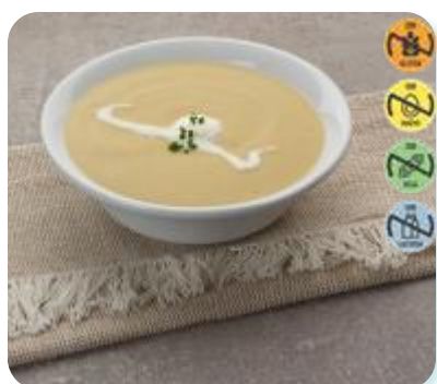
Triturado Huevo, Calab. y Patata 26620 2,5 kg 3 Ud. Caja HEALTH CARE