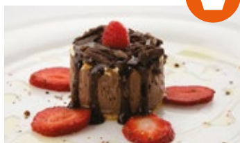
Delicia de chocolate con frutos rojos y crujiente de chocolate