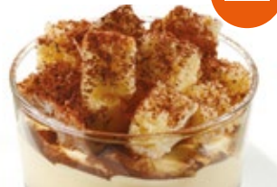
Tiramisú con gelatina de café y dados de bizcocho al cacao