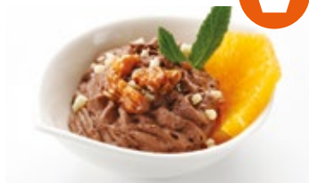
Mousse chocolate con naranja fresca