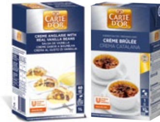
Salsas listas para usar