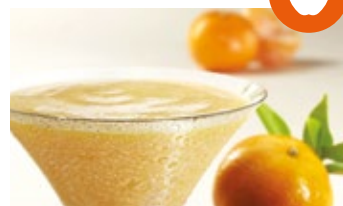
Sorbete de mandarina y mango