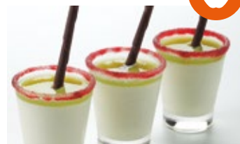
Sorbete de limón y manzana