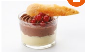
Choco-blanco en mousse