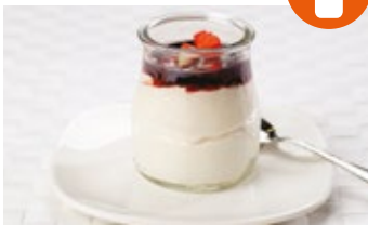
Cremoso al estilo griego con sirope de fresa