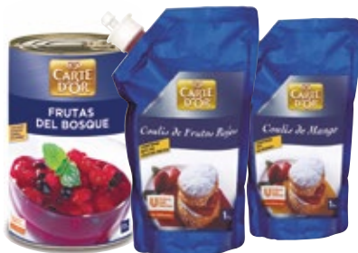
Coulis y complementos