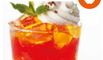
Gelatina de colores