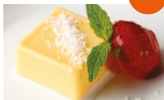
Mini flan de coco