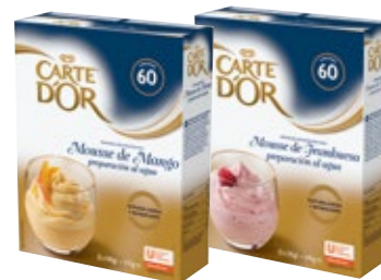
Mousses al agua