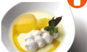
Panna Cotta de mango y mousse de nata