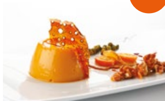
Flan de naranja y jengibre