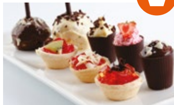
Variedad de minipostres para compartir