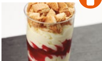
Mousse de yogur con galleta y frutos rojos