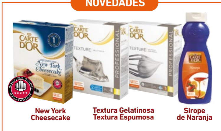
New York Cheesecake