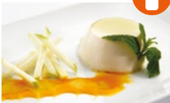
Panna Cotta al té verde