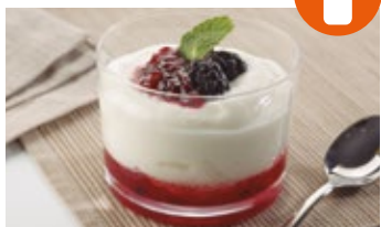
Crema de sabor yogur con frutas del bosque