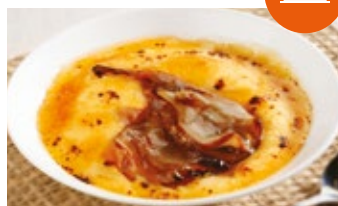
Crema catalana con crujiente de pera