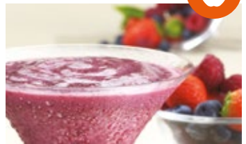
Batido de fresa de frutas del bosque