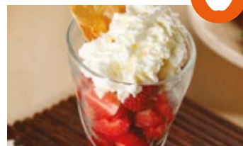
Fresas con nata