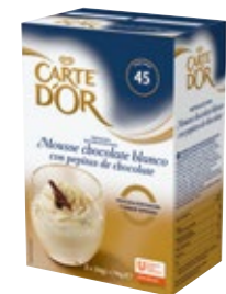
Mousses con trocitos